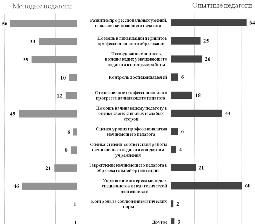
Рис. 4. Основные задачи школьного наставничества, в %. Ответы на вопрос «Как Вы считаете, каковы основные задачи школьного наставничества?»

Хотя практически все участники опроса уверены, что «начинающим педагогам лучше всего учиться у более опытных коллег, так как те имеют большой практический опыт», у начинающих учителей все же существуют некоторые сомнения по поводу того, что «наставник – главный помощник для молодого педагога в школе». В рейтинге предпочтительных для них форм профессионального развития «индивидуальная помощь со стороны наставника» занимает далеко не первое место. Опытные педагоги, напротив, ориентируются на индивидуальный подход к подопечному, реализовать который возможно через институт наставничества.