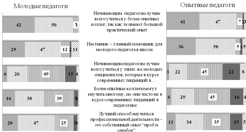
Рис. 1. Представления молодых и опытных педагогов об институте наставничества, в %.

По результатам исследования, опытные педагоги, представляющие региональные образовательные организации, выше, чем их коллеги из Москвы, оценивают целесообразность обучения начинающих педагогов у молодых специалистов, а также чаще признают за ними право обучаться профессиональной деятельности на собственном опыте «проб и ошибок». Это наглядно продемонстрировано на рис. 2, где представлены индексы, полученные на основании оценок респондентов. Они рассчитывались как разность долей положительных («полностью согласен» и «скорее согласен») и отрицательных («скорее не согласен» и «полностью не согласен») ответов. К разности прибавлялось 100, чтобы избежать появления