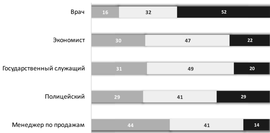
Рис. 3. Престижность профессии педагога по сравнению с другими профессиями:

В ходе опроса педагогам было предложено вспомнить, что в первую очередь повлияло на