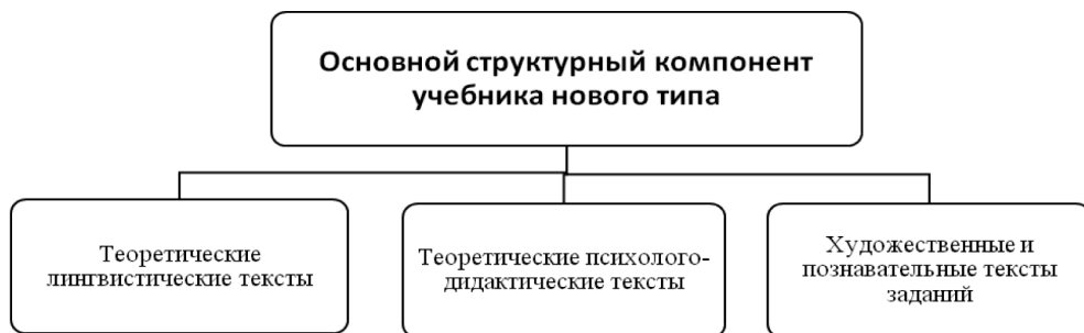
Рис. 2. Основной структурный компонент учебника нового типа

Основной особенностью любого структурного компонента является то, что содержание текста и приемы, направленные на его понимание, интересны школьнику. Важно, что в этих рассказах отсутствуют нравоучения, а высокие понятия даются не пафосно, не «в лоб», а исподволь, часто иносказательно. Для решения каждой из названных задач, выполняющих определенную функцию воспи-