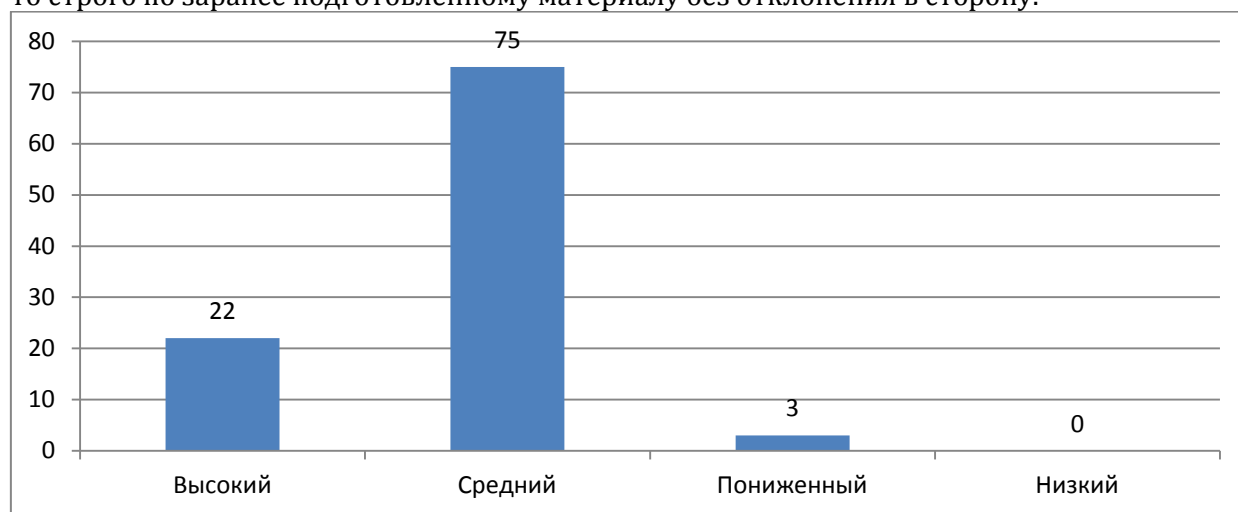
Рис. 2. Результаты оценки коммуникативных умений учащихся по методике А. Навантерри по уровням овладения (%)

Абсолютное меньшинство детей (3 %) испытывают некоторые коммуникативные трудности, например, им сложно устанавливать новые социальные связи, особенно если это требуется сделать в незнакомой обстановке. Эти учащиеся могут по-настоящему уверенно ощущать себя только в окружении хорошо знакомых людей. Если они и соглашаются на публичные выступления (доклады, сообщения перед классом или несколькими классами), то строго по заранее подготовленному материалу без отклонения в сторону.