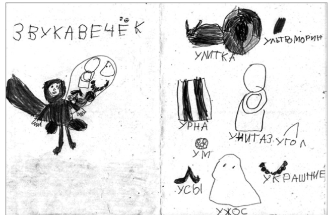
Рис. 1. Звукочек [У]