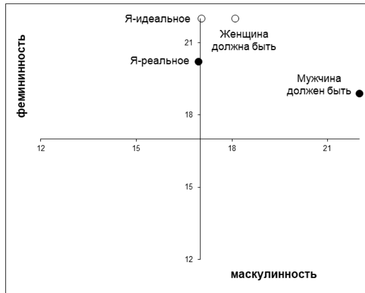
Рис. 4. График средних значений по выборке мужчин с расстройствами личности (n=19)

При сравнении с нормативными группами распределение в большей степени соответствует женской нормативной выборке. При этом можно наблюдать отсутствие выраженности фемининных качеств образа «Я-реальное», что говорит о недостаточном уровне дифференциации «Я» относительно мужского или женского образа. Следовательно, отмечается недостаточный уровень интериоризации фемининной гендерной роли на логическом уровне.