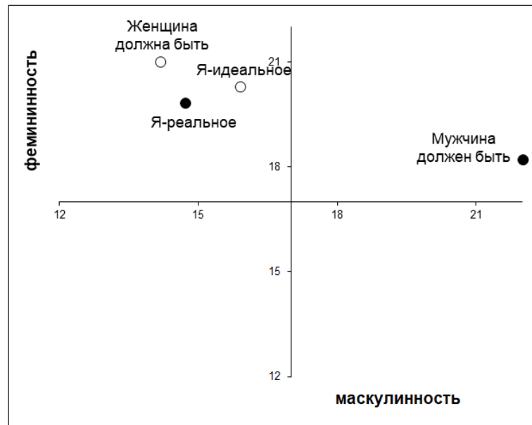
Рис. 2. График средних значений выборки мужчин-транссексуалов (n=11)

Высокая степень андрогинности образа «Я-идеальное» свидетельствует о существующем адаптивном потенциале мужчин с транссексуализмом.