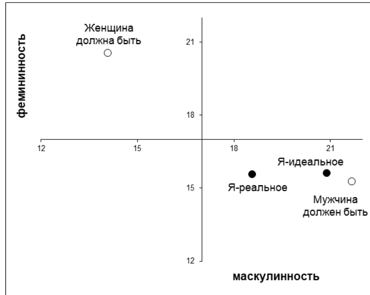
Рис. 3. График средних значений по выборке женщин с расстройствами личности (n=27)

«Я-реальное» и образа мужчины, что, по-видимому, может отражать дезадаптивный потенциал в сфере полового самосознания.