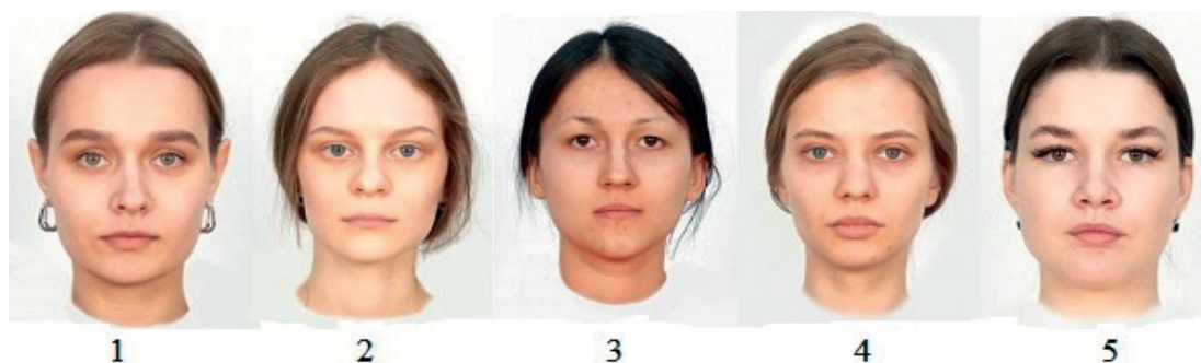
Рис. 2. Морфотипы лица: 1 – ромбовидный; 2 – треугольный; 3 – круглый; 4 – квадратный; 5 – прямоугольный

Методики исследования. Для изучения оценок восприятия индивидуально-психологических характеристик незнакомого человека и уровня доверия/недоверия к нему по фотоизображению его лица до и после перцептивного взаимодействия использовались две методики.