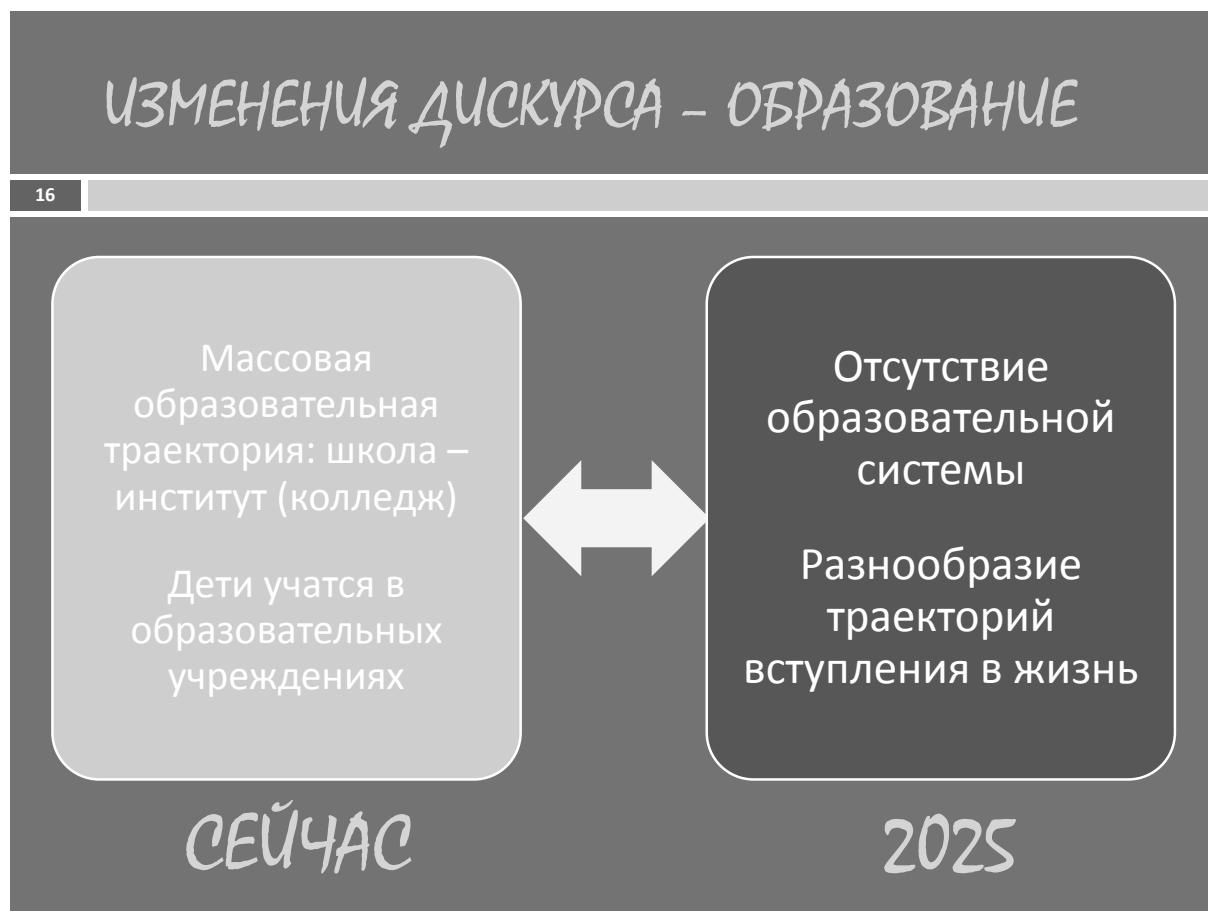
Рис. 7. Фрагмент дорожной карты «Детство-2030»: модернизация системы образования и воспитания

как просто можно проверить правильность написания глагола: нужно к нему задать вопрос «что делать?» или «что делает?». Если глагол отвечает на первый вопрос, то в нем, как и в слове «делать», пишется мягкий знак, если же он отвечает на второй вопрос – то мягкий знак не пишется.