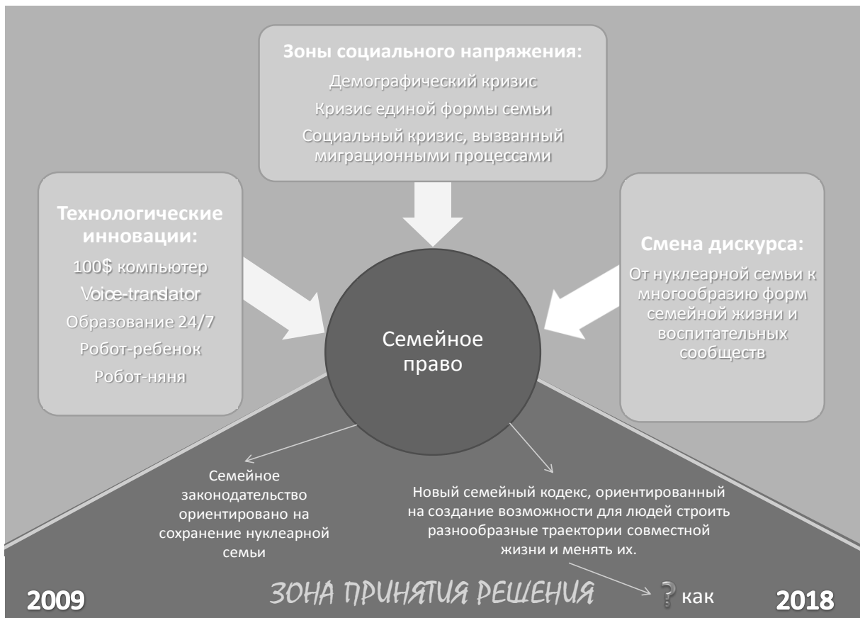
Рис. 5. Фрагмент дорожной карты «Детство-2030»: легитимизация либеральным трендам как ответ на вызовы будущего

Очевидно, что подобного рода выводы не могут быть сделаны на основании ознакомления с заглавными, эмоционально-экспрессивными императивами, провозглашаемыми пропагандистами изучаемого проекта: обертка серьезно отличается от содержимого. Более того, выявляется вполне четкое противоречие заявляемого и фактически развиваемого идейно-мировоззренческого материала. Это, в свою очередь, подтверждает ранее высказанную мысль о том, что современник обязан очень тщательно относиться к метафизической плоскости собственной жизни, обдумывая и осмысляя появляющиеся концепции.