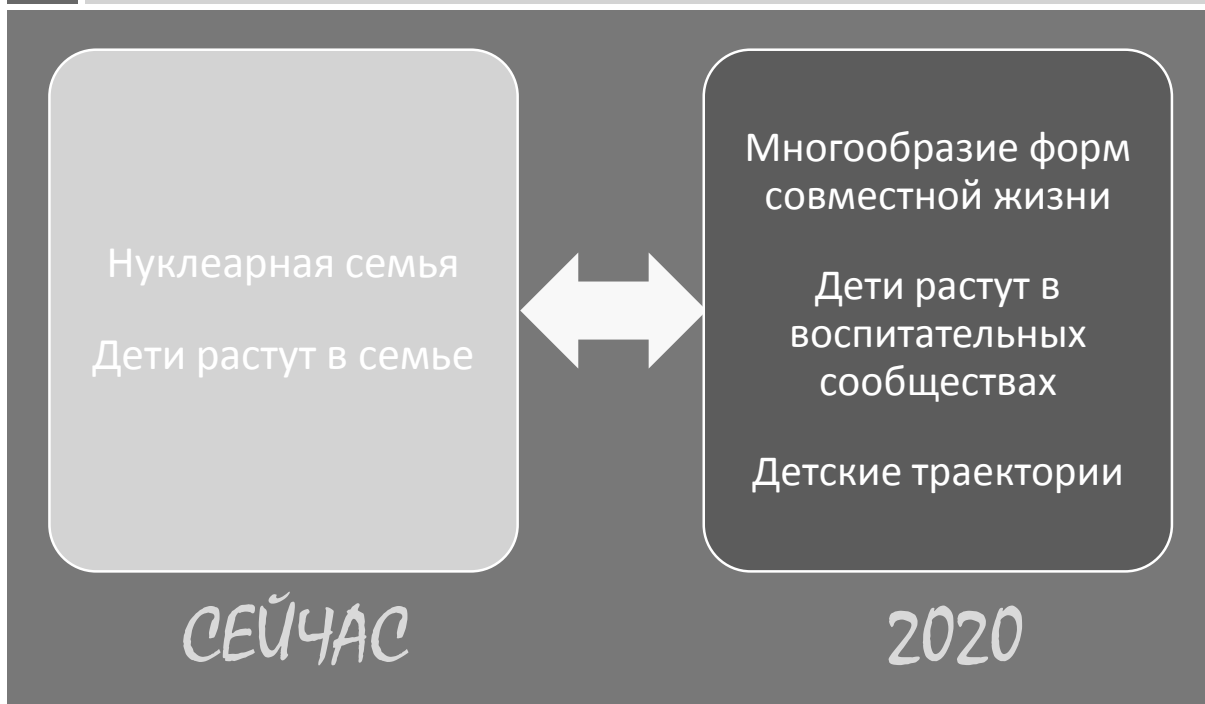
Рис. 4. Фрагмент дорожной карты «Детство-2030»: ретроградные устои бросают вызов либеральным трендам

В указанном разделе можно прочесть следующее: «В случае невозможности по тем или иным причинам сохранить традиционную форму семьи, пары вынуждены прибегать к процедуре развода. Юридическое оформление процедуры подразумевает присуждение детей одному из родителей, что в итоге законодательно и институционально нарушает траекторию развития детей. А если учесть то, что в некоторых цивилизованных странах до 80 % браков заканчиваются разводом, то можно представить, какое количество детей пребывает в заблуждении (выделено мной – М. Ф.), что связаны только с одним родителем. Происходит расслоение детей на тех, у кого родители разведены, либо отсутствуют, либо не принимают участия в их воспитании, и на тех, у кого традиционная форма семейных отношений пока сохранена (выделено мной – М. Ф.) [5].