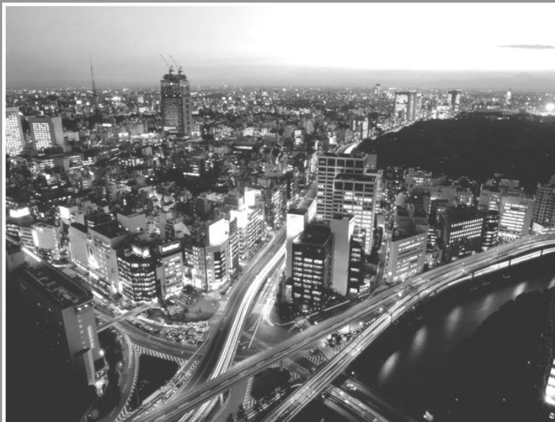
Рис. 1. Фрагмент дорожной карты «Детство-2030»: неоднозначно-противоречивый посыл к выводам

□ СМОЖЕТ ЛИ РОССИЯ ОСТАТЬСЯ ЖИЗНЕСПОСОБНОЙ В МЕНЯЮЩЕМСЯ МИРЕ?