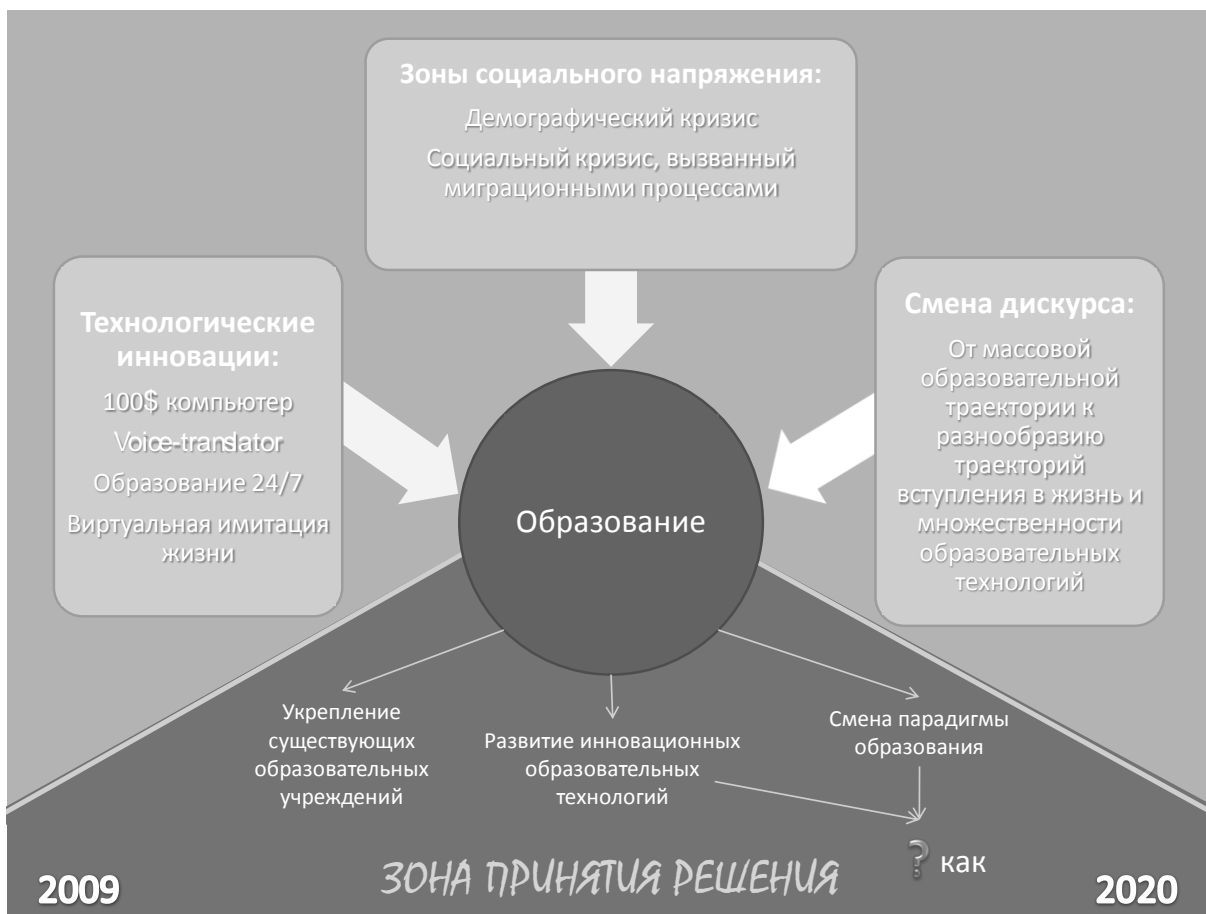
Рис. 8. Фрагмент дорожной карты «Детство-2030»: смена дискурса в системах образования и воспитания

Еще более сложные выводы возникают после ознакомления с воззрениями президента Международной методологической ассоциации, являющегося одним из разработчиков и идеологов форсайт-проекта «Детство-2030».