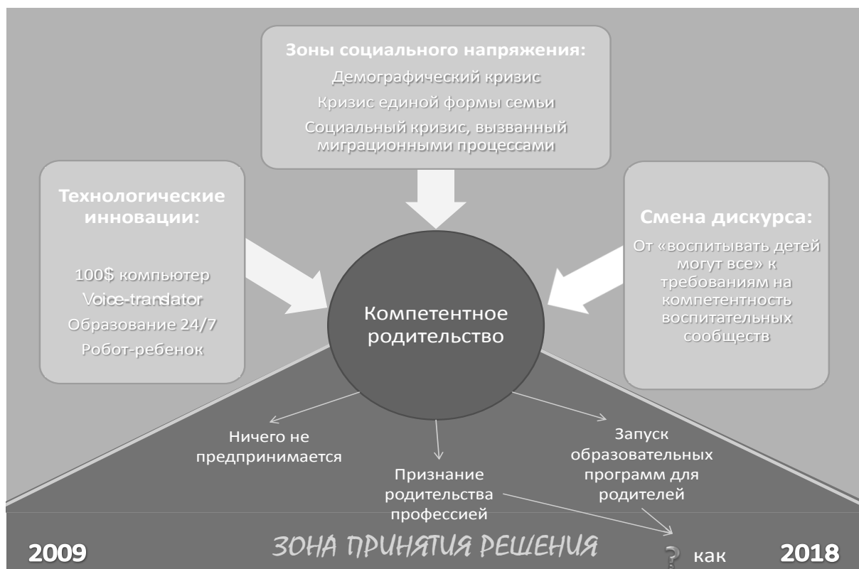
Рис. 6. Фрагмент дорожной карты «Детство-2030»: инновационные концепты, отвечающие на вызовы будущего

Закономерно, что система действий предусматривает специфические, аутентичные идеи, которые поступательно проводятся через весь Проект. В этом смысле идея семьи – всех аспектов, связанных с ее бытием и функционированием, – не оказывается исключительно авторской. Действительно, инновационно-новаторской предстает идея о компетентном родителстве.