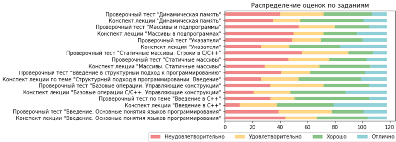
Рис. 3. Распределение оценок по заданиям

тем лучше он выполняет задание по ней. Также у студентов, которые провели в системе большее количество времени за изучением учебного материала или его выполнением, итоговые оценки выше, чем у тех, у кого продолжительность присутствия на курсе была меньше. При этом график распределения оценок по заданиям выглядит следующим образом (рис. 3).