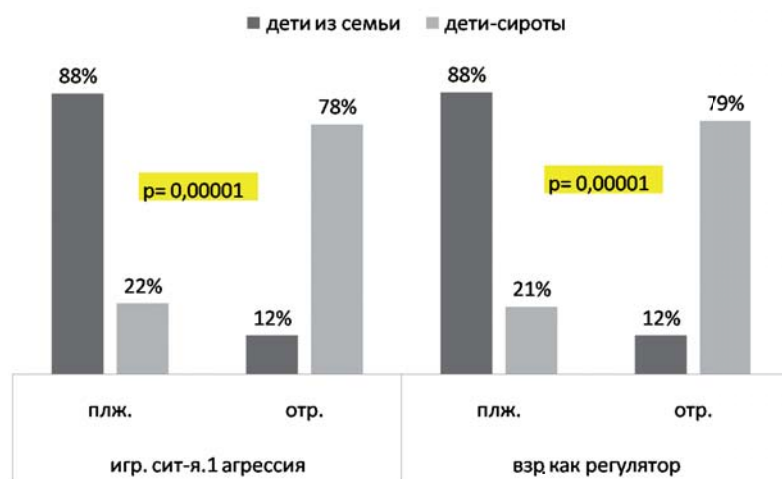
Диаграмма 3. Распределение исходов игровой ситуации, соответствующей общей характеристике поведения в двух выборках, направленных на выявление у испытуемых детей представления о взрослом как регуляторе поведения, воспитателе

Полученные данные свидетельствуют, что дети-сироты способны осуществлять заботу по отношению к другому в меньшей степени, чем дети из семьи. Представление о взрослом как о партнере по взаимодействию и общению в выборке детей-сирот в большинстве случаев носит отрицательный характер: дети-сироты не склонны уважать цели и желания партнера, принимать отказ подчиняться требованиям другого; у большинства из них наличествует представление о взаимоотношениях взрослого и ребенка как начальника и подчиненного. Однако значительная (чуть меньше поло-