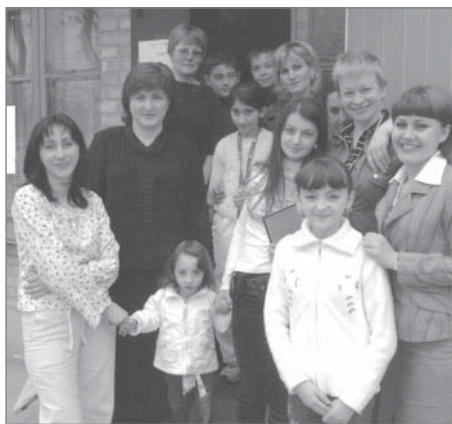
Встреча с детьми, проходившими реабилитацию в подмосковных лагерях. Беслан, май 2006 г.

В 2006 году 320 выпускников пятого курса МГППУ