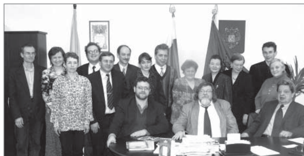
Авторы-разработчики электронных учебников

воспитания и развития детей, а также профилактике правонарушений личностного развития», созданы и поддерживаются сайты, которые ежедневно посещают более 3 000 человек: