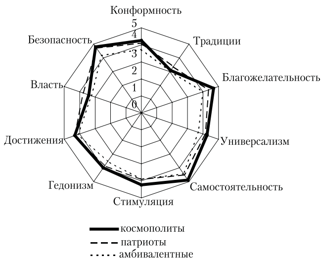
Рис. 2. Ценности — нормативные идеалы у респондентов с разными типами этнонациональных установок

рых только по двум ценностям — благожелательности и власти обнаружены различия на уровне статистической тенденции (Sig. = 0,74; 0,62). Можно говорить о наличии тенденции к более высокому уровню благожелательности у «космополитов» по сравнению с «амбивалентными». Значимость различий по ценности власти обнаружена только по критерию наименьшей значимой разности (LSD), который наиболее подвержен ошибкам [8], следовательно, достоверность обнаруженной нами большей значимости власти для «патриотов» достаточно низкая.