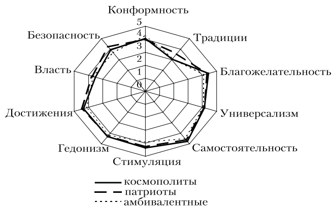
Рис. 3. Ценности — индивидуальные приоритеты у респондентов с разными типами этнонациональных установок

Ценность гедонизма важнее для «патриотов», по сравнению с «амбивалентными», однако также только по критерию LSD, что говорит о высокой возможности ошибки.