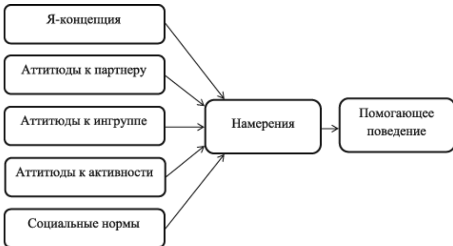
Рис. 2. Факторы помогающего поведения

• Аттитуды к ингруппе включают в себя черты, которые человек приписывает представителям волонтерской органи-