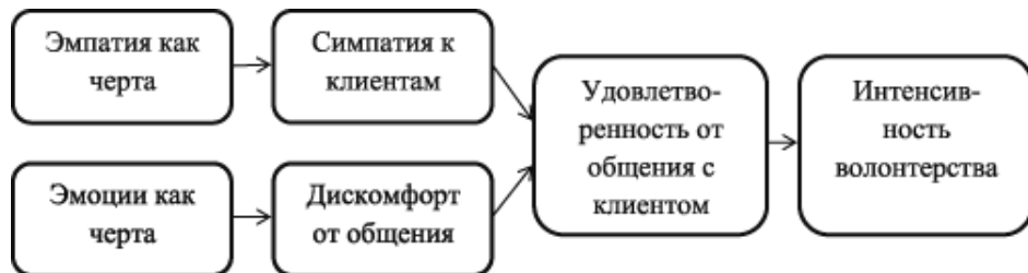
Рис. 3. Влияние эмоционального состояния и эмпатии на интенсивность волонтерской деятельности

менте Б. Сайма и С. Стермера [25; 26], в котором принимали участие немецкие студенты, занимавшиеся волонтерской деятельностью. Каждый из них «получал» партнера — иностранного студента, приехавшего учиться в Германию. Он должен был помочь иностранцу адаптироваться в новой среде: показать университет и город, познакомить с другими студентами. Некоторые иностранцы приехали из похожих на Германию стран — Великобритании, Швеции, США; другие — из стран, сильно отличающихся от Германии, например, Камеруна и Китая. Все волонтеры заполняли опросники, которые позволяли измерить аффективный компонент эмпатии к «своему» иностранцу (должны были отметить, в какой степени они испытывают по отношению к нему сочувствие, симпатию, интерес); а также его представление о партнере (степень привлекательности, достойности доверия и т. д.). В конце исследования иностранные партнеры оценивали степень помощи со стороны волонтеров. Результаты исследования показали, что уровень эмпатии предсказывал помогающее поведение в парах, где иностранец был выходцем из похожей страны. В разнокультурных парах она зависела