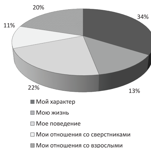
Рис. 2. Распределение ответов на вопрос «Я думаю, что работа бригадиром больше всего изменила...»

В равной степени (по 13%) в рамках типологии Л.И. Уманского отмечены проявления у бригадиров лидерства типа «мастер», «организатор», «генератор эмоционального настроения».