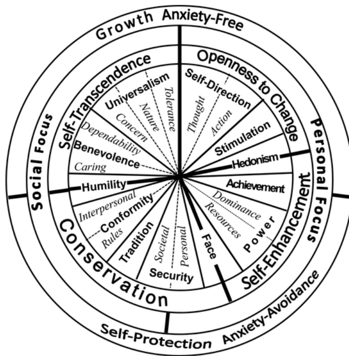
Fig. A1. The layout of 19 values (Schwartz et al., 2012)