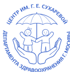
ГБУЗ «Научно-практический центр психического здоровья детей и подростков им. Г.Е. Сухаревой ДЗМ»