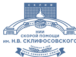
ГБУЗ «Научно- исследовательский институт скорой помощи им. Н. В. Склифосовского Департамента здравоохранения города Москвы