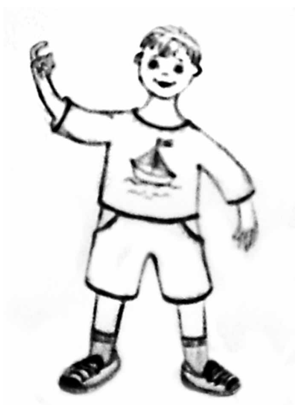
Рис. 3. «Подойди». (Художник: Лаврентьева Мария).

Активно используя в работе с детьми жесты, мы руководствовались адаптированными программами по использованию жестов в развитии коммуникативных навыков. ■