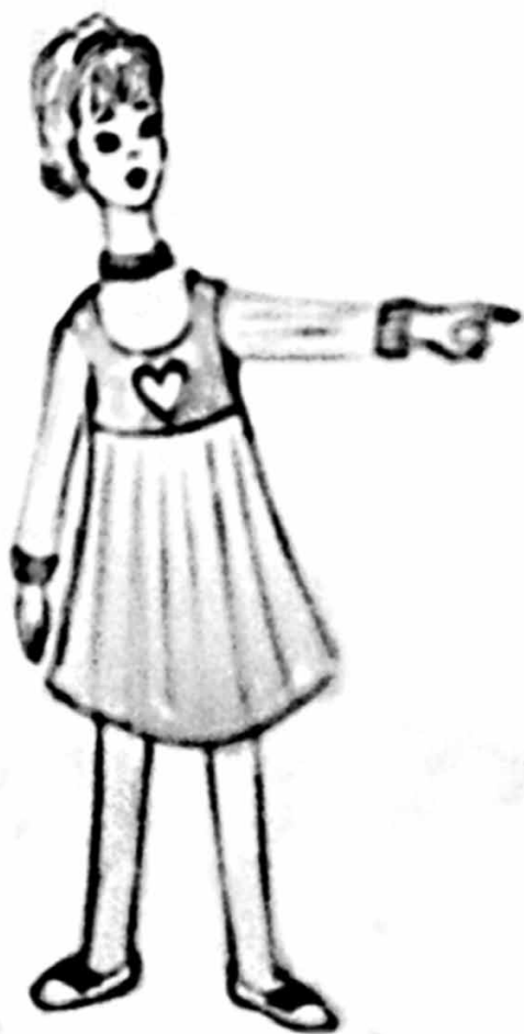
Рис. 1. Указательный жест. (Художник: Лаврентьева Мария).

которому не хватает визуальной связи с процессом поглощения еды. Однако, когда слово «еда» сочетается с соответствующим жестом, у ребенка появляется возможность услышать словесное обозначение данного действия и увидеть само действие. Затем, по мере того как слово «еда» сольется с жестом, и оба станут частью системы поглощения пищи, ребенок сможет понимать слово на слух и в отсутствие жеста и использовать картинку с написанным словом.