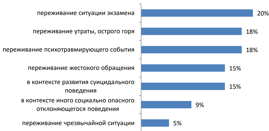
Рис. 1. Представленность ситуаций, в которых педагоги-психологи оказывают кризисную психологическую помощь обучающимся

На рис. 1 представлено распределение ответов педагогов-психологов по типам ситуаций, в которых они оказывают кризисную помощь обучающимся.