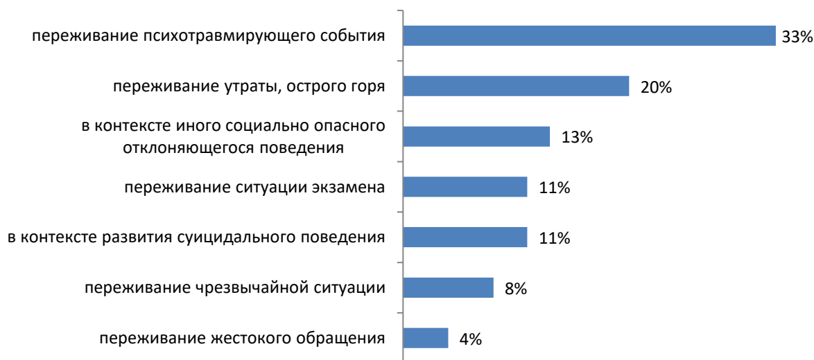
Рис. 3. Представленность ситуаций, в которых педагоги-психологи оказывают кризисную психологическую помощь педагогам

На рис. 3 представлено распределение ответов педагогов-психологов по типам ситуаций, в которых они оказывают кризисную помощь педагогам.