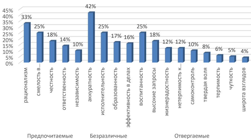
Рис. 2. Представленность инструментальных ценностей студентов

Выявлено, что среди предпочитаемых инструментальных ценностей наибольшее признание получили те, что дают возможность быть самостоятельными, проявить себя, показать свою взрослость и значимость. Среди отвергаемых представлены ценности, которые связаны с контролем своего поведения и качествами, связанными с отношением к другим людям.