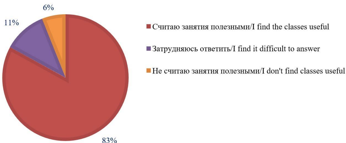
Рис. 2. Эффективность занятий по программе «Уроки психологии: путь к себе» (по мнению классных руководителей ОО, %, n = 140)

Kuznetsova A.A., Oltarzhevskaya L.E., Egorova L.V., Golerova O.A., Levitskaya M.P. (2025) The program of psychological and pedagogical classes “Psychology lessons: the path to self” as a tool for creating conditions for strengthening and preserving the psychological well-being of students Bulletin of Practical Psychology of Education , 22(2), 3—20.