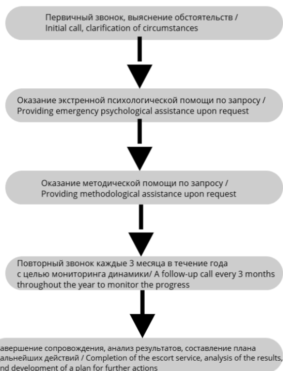
Рис 1. Алгоритм работы с образовательной организацией, в которой находится несовершеннолетний, демонстрирующий суицидальное поведение Fig. 1. Algorithm for working with an educational institution that has a minor exhibiting suicidal behavior