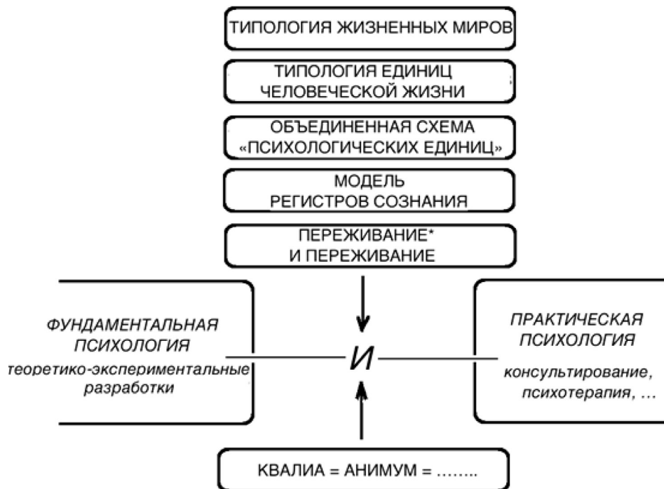
Рис. 1. Объединяющее «И»

У Аристотеля, в его Учении о четырех причинах, я нашел некоторые опоры к определению ощущения. Я заметил, что все четыре аристотелевские причины уникальным образом «сходятся» в ощущении (материальная — «то, из чего»; формальная — то, «в форме чего»; действующая — «то, посредством чего»; и