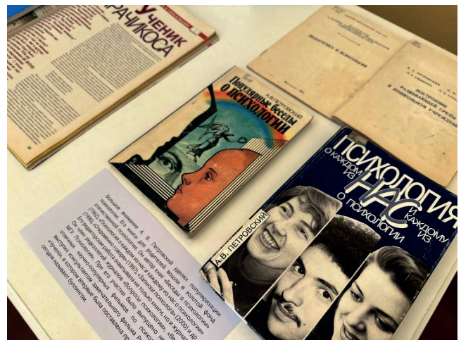
Книжная выставка «Психология и время».