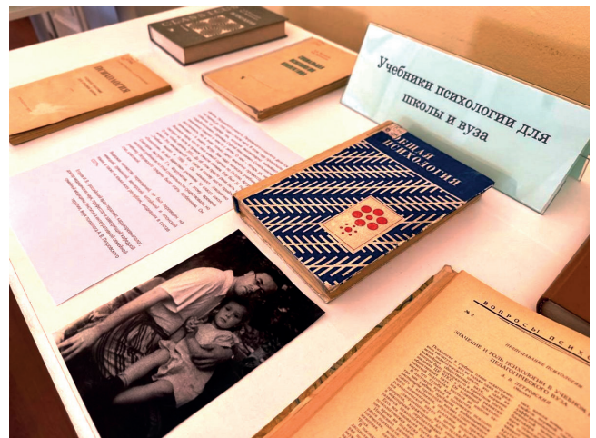
Книжная выставка «Психология и время».