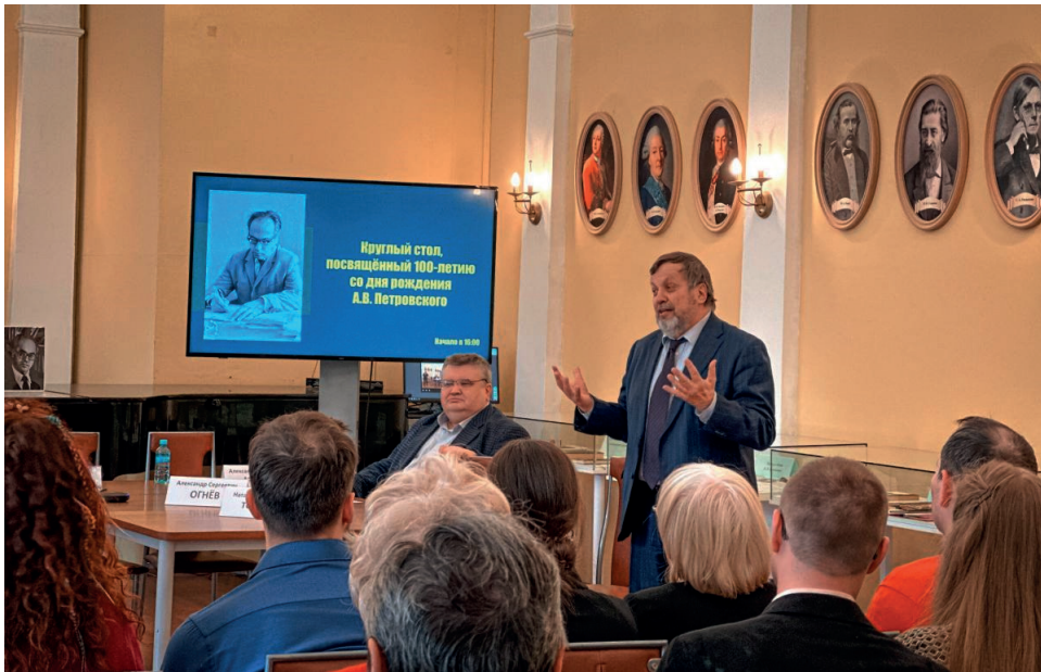
Круглый стол, посвященный 100-летию А.В. Петровского.

Обращаю внимание на еще одну особенность Артура Владимировича: это бережное отношение к каким-то новым идеям, которые он не просто мог оценить, но дал возможность и развить в дальнейшем. А некоторые из них очень продуктивны в плане дальнейшего, это проявляется у нас прямо сейчас, например, когда вдруг на территории Интернета появляются особые группы, появляются значимые люди, «отраженная субъектность», общность особого рода. И тут есть мощное методологическое основание, которое можно было бы еще развивать. Это важно, поскольку много сейчас вспоминаем о Петровском-старшем как о личности, но при этом недооценен тот шаг, который в будущее сделан, как методологическая основа понимания и исследование того, что сейчас возникает.