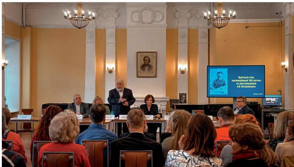
Открытие Круглого стола, посвященного 100-летию А.В. Петровского.