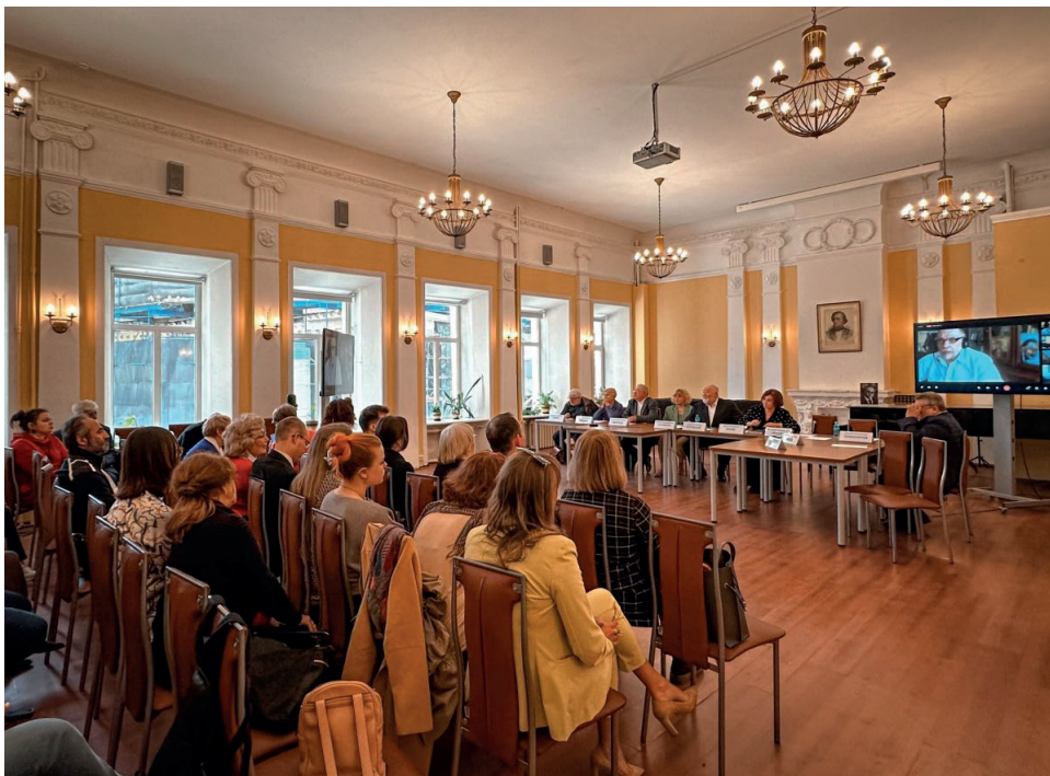
Круглый стол, посвященный 100-летию А.В. Петровского.