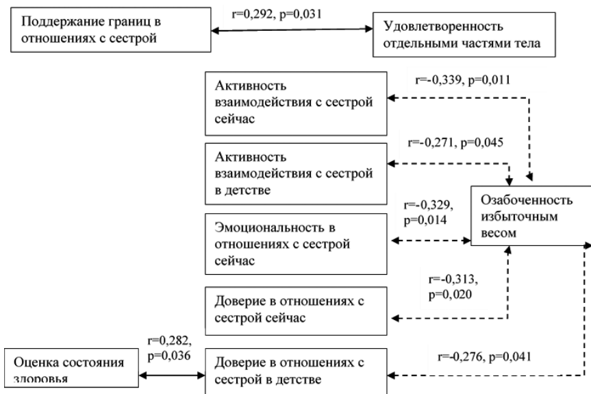
Рис. 2. Отношения с сестрой и оценка собственного тела у девушек из двухдетных семей (n = 55)

Для девушек, имеющих сестер, удовлетворенность разными частями собственного тела связана с поддержанием личностных границ при взаимодействии с сестрами. Наличие доверия в отношениях с сестрой в детстве связано с более высокой самооценкой здоровья. Так же, как и для группы девушек с братьями, были выявлены обратные корреляции между доверием, активностью и эмоциональностью отношений с сестрами и озабоченностью избыточным весом у девушек (рис. 2).