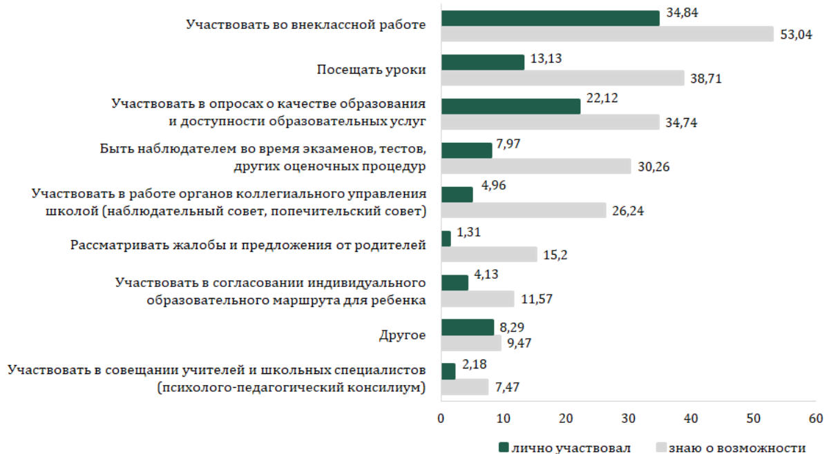
Рис. 2. Соотношение осведомленности родителей об их возможностях участия в формах работы ОО и реального участия в них (% выбора, N=89 947)

О каких возможностях участвовать в жизни школы, где учится Ваш ребенок, Вы знаете?