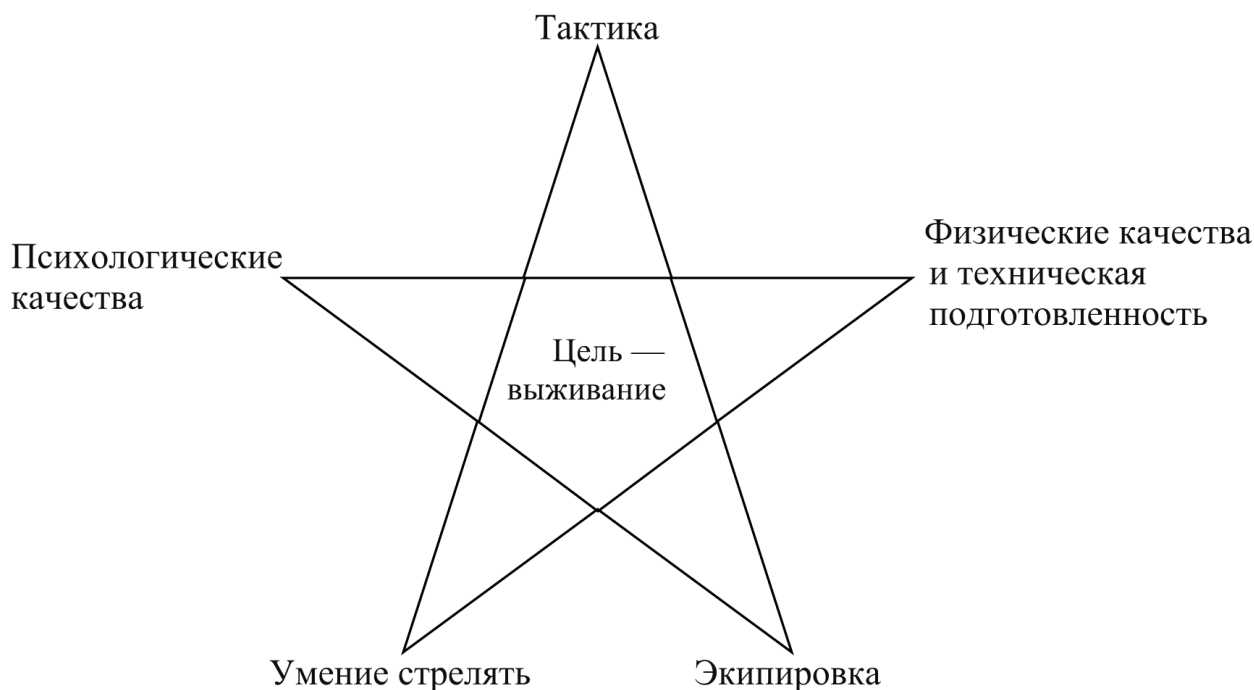
Рис. 3. Основные факторы личной безопасности сотрудников («Звезда выживания»)

Учеными, занимающимися проблемой повышения личной безопасности сотрудников силовых структур и правоохранительных органов, продолжалась разработка психотехнических мер по модели «Звезда выживаемости» (Рисунок 3), которая была создана в 1980-х годах сотрудниками научного подразделения ФБР (США) и имплементирована в отечественную психопрактику благодаря пособиям профессоров А.В. Буданова и А.И. Папкина.