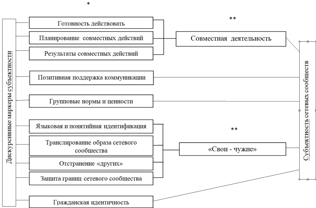
Рис. 1. Компоненты субъектности сетевых сообществ

описать индикаторы которых не удалось в полном объеме: так, «представления о будущем» маркировались не только глаголами будущего времени, как мы изначально предполагали, но и выражались более сложными языковыми формами.