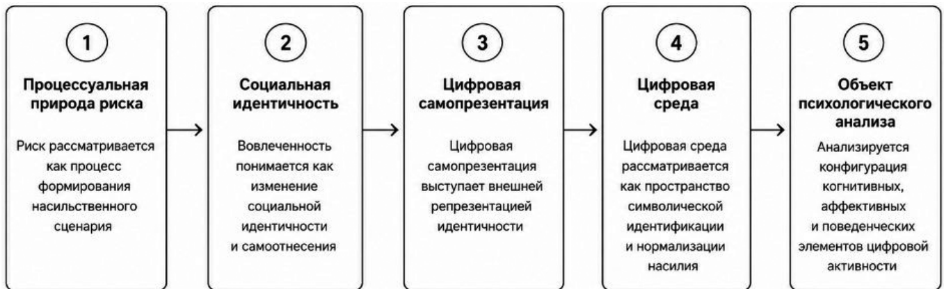
Рис. 1. Пять теоретических положений модели анализа цифровой самопрезентации

Теория социальной идентичности (Tajfel, Turner, 1986) исходит из того, что значимая часть самопонимания человека формируется через принадлежность к социальным группам. Идентичность в этой логике не является только внутренним психологическим состоянием: она выражается через язык, символы, нормы, эмоциональные оценки и поведенческие ожидания, разделяемые внутри группы. В настоящей статье понятие социальной идентичности используется как способ отнесения субъектом себя к значимой социальной категории, группе или воображаемому сообществу. При анализе вооруженных нападений в образовательных организациях данный подход позволяет рассматривать цифровой контент через позицию пользователя по отношению к насильственной тематике: дистанцированное наблюдение, подражание, принятие групповых смыслов, стремление к признанию внутри соответствующей среды. Символы, эстетика, эмоциональные реакции и другой контент рас-