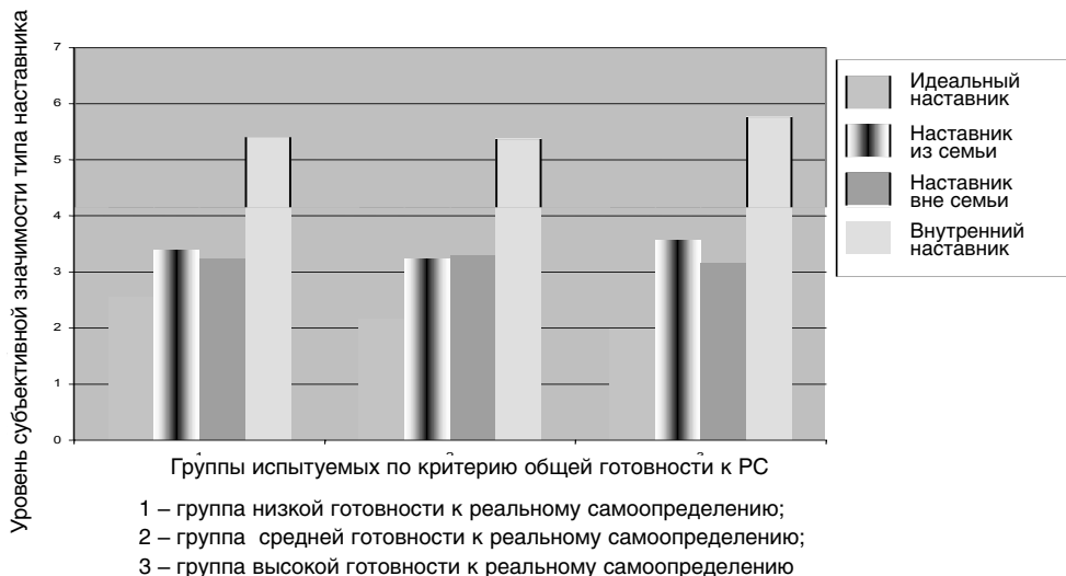
Рис. 1. Ориентирующий образ наставника в связи с готовностью к реальному самоопределению

• В группе низкой готовности к РС наставник из семьи в сфере мировоззрения менее выражен ( p < 0,05 ), чем в группе высокой готовности. Значимых различий между группами низкой и средней готовности в субъективных оценках реальных наставников не было выявлено, но следует отметить у группы низкой готовности более выраженную, чем в средней группе, представленность типа наставника из семьи в ориентирующем образе по всем сферам психосоциального развития. При этом