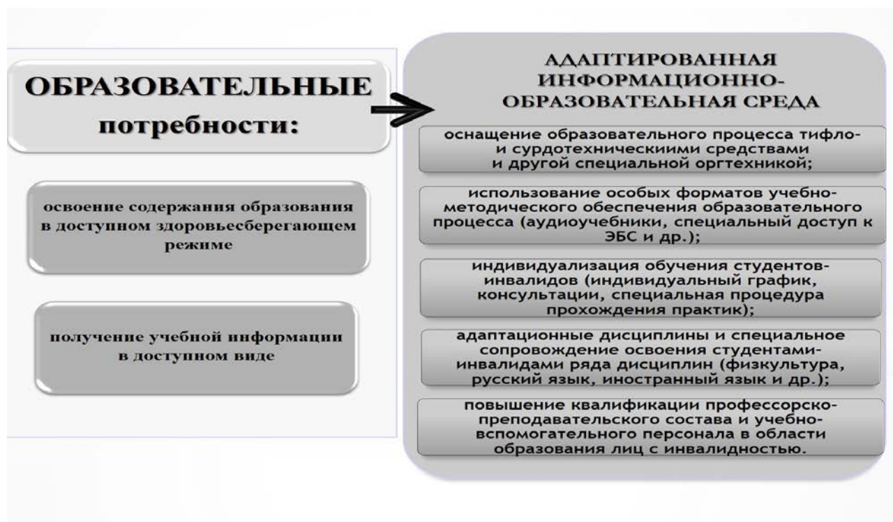
Рис. 2. Особые образовательные потребности студентов-инвалидов и структура адаптированной информационно-образовательной среды вуза

Тем самым в результате реализации совокупности разноплановых взаимодополняющих мер по адаптации информационно-образовательной среды вуза формируются специальные условия, необходимые для удовлетворения особых образовательных потребностей студентов-инвалидов в процессе инклюзивного обучения (рис. 2).