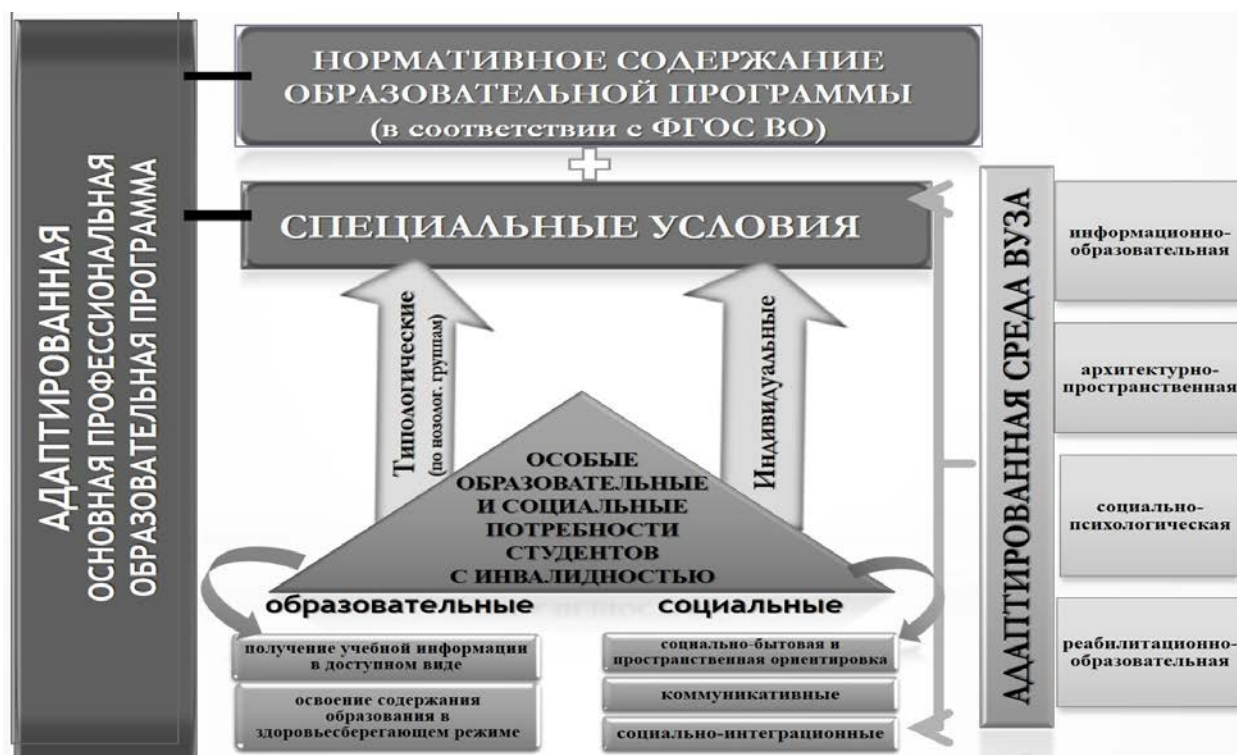
Рис. 1. Особые потребности студентов-инвалидов и структура адаптированной среды вуза в системе реализации адаптированной основной профессиональной образовательной программы

Сложившаяся таким образом система представлений (рис. 1) может и должна быть детализирована и перенесена в практическую плоскость.