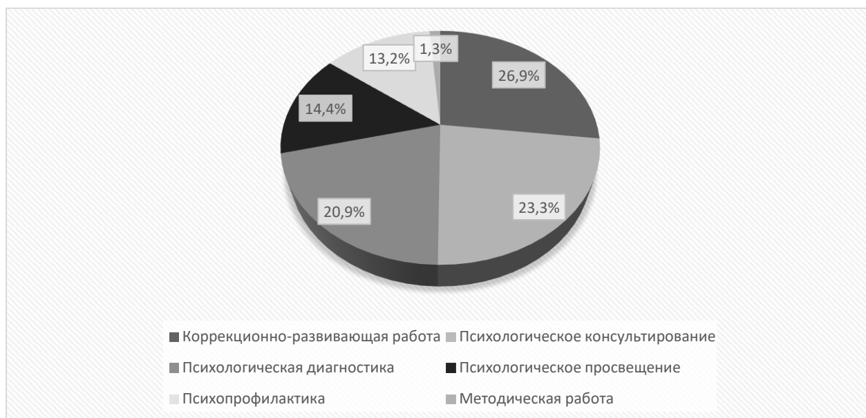
Рис. 2. Распределение затрат времени респондентов на реализацию основных видов деятельности

В разрезе типов образовательных организаций процентное соотношение времени, которое респонденты затрачивают на реализацию основных видов деятельности, представлено в табл. 4.