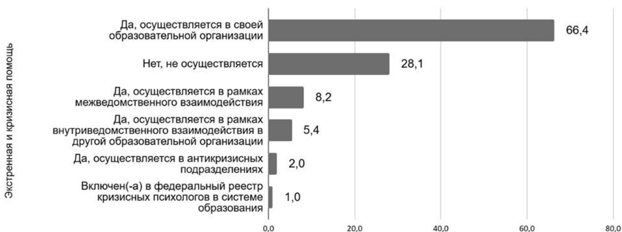
Рис. 3. Распределение способов осуществления экстренной и кризисной психологической помощи

Принцип доступности психолого-педагогической помощи обучающимся обеспечивается в том числе развитием системы экстренной, кризисной помощи участникам образовательных отношений. В этой связи в рамках Мониторинга изучены региональные механизмы реализации экстренной, кризисной психологической помощи. Распределение ответов респондентов представлено на рис. 3.