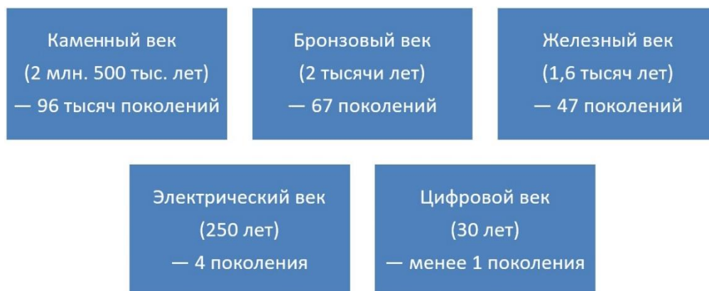
Рис. Скорость развития орудий труда

Генезис современного общества обусловлен колоссальными изменениями в социальном инструментарии, который является как воздействующим, так и изменяющимся фактором — под влиянием объективных и субъективных особенностей общественного развития. Неизменным остается тот факт, что человек — существо социальное и его выживаемость, как вида, зависит от совместной общности. Наглядно демонстрирует происходящее преобразование в различных областях человеческой деятельности скорость изменений орудий труда, передающихся от поколения к поколению, с целью их освоения, применения и совершенствования (см. рис.).