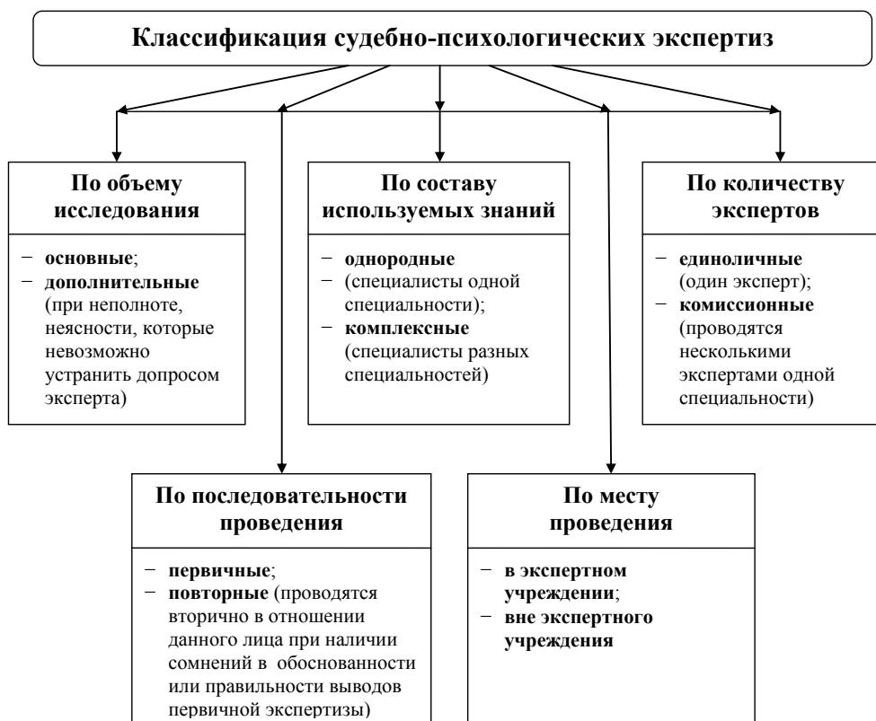
Рис. 2. Классификация судебно-психологических экспертиз

Основной является экспертиза, назначенная для решения поставленных перед экспертами вопросов. Дополнительной по отношению к ней считается новая экспертиза, назначенная в связи с неполнотой или недостаточной ясностью прежнего (основного) экспертного заключения, но при отсутствии сомнений в достоверности его выводов. Такая экспертиза проводится лишь тогда, когда