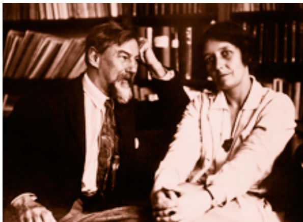
Эдуард Клапаред и Елена Антипова в Женеве. 1925–1928 гг.

В 1922 году Бразилия стала независимой после 300-летнего периода пребывания колонией Португалии. Консолидация республиканского режима повлекла за собой реформирование образовательной системы, целью которого стала модернизация начальной и средней школы, улучшение подготовки школьных учителей, особенно в сельских районах. Создание экспериментальных лабораторий психологии становится важным шагом на пути реализации реформ. Переплывая Атлантику по пути к своему новому месту жительства в август-