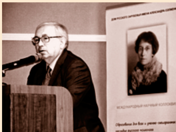
Владимир Петрович Лукин, уполномоченный по правам человека в Российской Федерации. Июнь 2012 г.