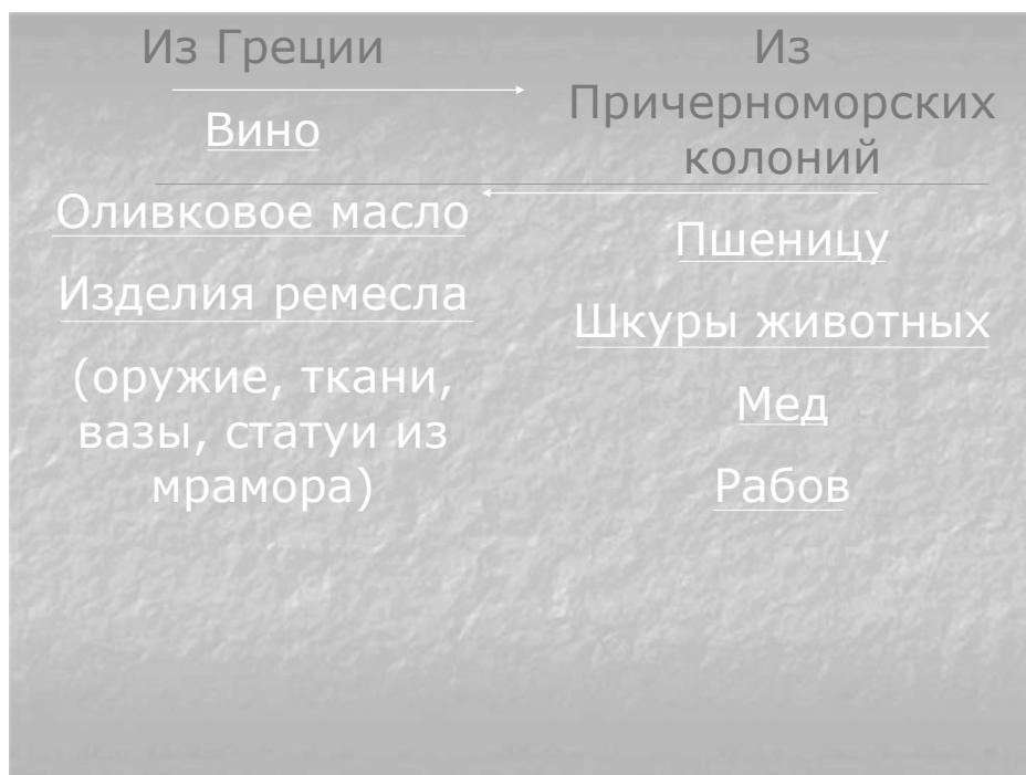
Рис. 4. Импорт и экспорт в Древней Греции