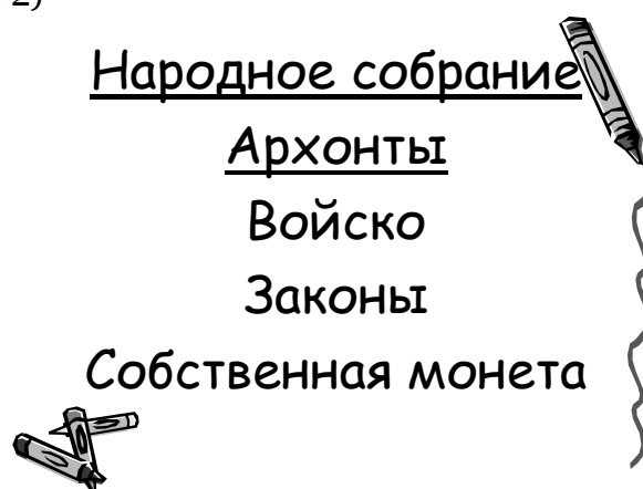
Рис. 2. Работа с понятием «колония»