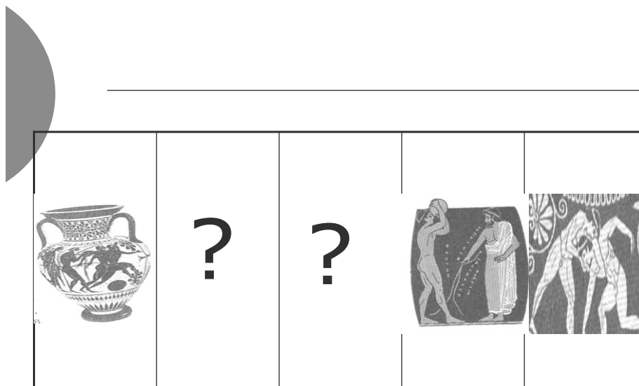
Рис. 6. Виды состязаний