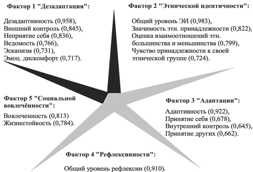
Рис. 2. Факторная структура функциональной системы социальной адаптации подростков-мигрантов