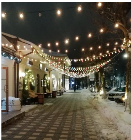
Рис. 10. Светящаяся гирлянда

Кейс № 10. Вечером я шла по улице и увидела фонарики. Я сразу подумала, что детей можно сравнить с фонариками. Фонарики разноцветные, каждый светится своим светом и энергией. Когда они вместе, они дополняют друг друга и получается многообразие цвета. Мое отношение к детям очень поменялось. Раньше я не подозревала, что у каждого ребенка есть свой «свет». Сейчас я поняла, что каждый интересен по-своему, смотрит на мир по-другому, не так, как ты. Каждый раз можно удивляться тому, что многие из детей очень талантливые и знают то, что не знаю я, умеют то, что не умею я. Когда эти фонарики собираются вместе, то получается красивая гирлянда. У меня нет сестер и братьев, поэтому раньше я никак не взаимодействовала с детьми. Сейчас улица моей жизни стала светлее благодаря тому, что появились эти «фонарики». Я поняла, что с детьми интересно, весело, они дают мне новый свет в жизни, знания и новый опыт. Мое отношение к детям может быть выражено следующими словами: каждый ребенок имеет свой собственный свет, каждый важен и интересен по-своему. Когда они горят все вместе, это намного красивее... Они могут дать свой свет и энергию друг другу, нам, взрослым, помогают понять ценность жизни, по-новому взглянуть на нее... (см. рис. 10).