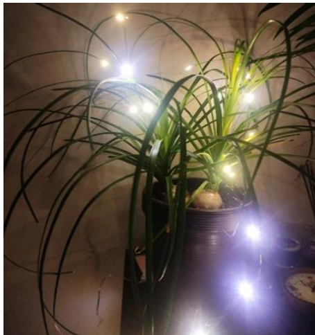
Рис. 8. Выращивание цветка

навыками, которые во мне развиваются. Я люблю учить детей и своих сверстников чему-то новому и именно так я передаю свои умения и навыки... (см. рис. 8).