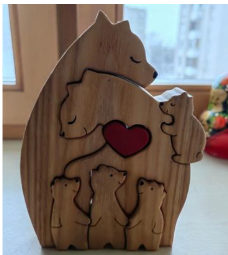
Рис. 5. Семья медведей

силу безусловной любви, как ее можно в себе воспитывать. Без поддержки своего мужа, мудрого хозяина нашей семьи, нашего дома, мне бы не справиться. Муж придавал мне силы, чтобы моя спина держала форму, удобную для всех моих близких и дорогих детей, для нашего маленького медвежонка. Без этой силы опоры маленький медвежонок не удержался бы там... (см. рис. 5).