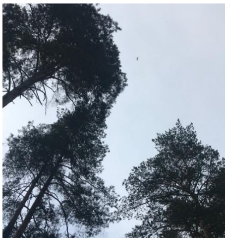
Рис. 4. Сосны

к ним нужен индивидуальный подход. В первую очередь кардинально изменилось мое отношение к ним. Они рады даже тому, что ты просто их обнял. У них горят глаза, они благодарят тебя за каждое проведенное мероприятие и встречу, это самое ценное, что может быть. Когда я стала работать в проекте, меня назначили руководителем театрального направления, с которым раньше редко сталкивалась. Но сейчас я задумываюсь о том, что можно связать данное направление со своим хобби и профессиональной сферой. Сама пишу сценарии и развиваюсь в данном направлении, но помимо этого можно учить и других людей этому. Например, когда была «Завалинка», на одной из станций квеста я сочиняла стихотворения с детьми. В проекте я выделила для себя трех человек, которые были, есть и останутся для меня очень важными людьми, с которыми я не перестану общаться: ребенок, специалист и вожатый-наставник. Сосны уже достаточно высокие. Они изменяются сейчас не только внешне, но и внутренне. У них наращивается потенциал и навыки, как многолетние кольца. Я всегда говорю такую фразу: «Дети все чувствуют», и если ты пока не готов к общению с детьми, то лучше не надо, а если все-таки решился, то старайся от начала и до конца... (см. рис. 4).