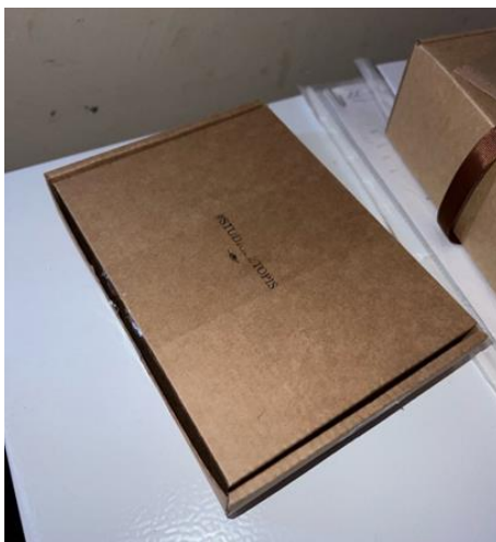
Рис. 3. Коробочка опыта

Кейс № 4. Это сосны, которые тянутся высоко вверх. В профессиональном отношении, участвуя в проектах, я выросла, как сосны, стала такой же высокой, сильной, могучей. Волонтеры, которые приходят вновь в проект, смотрят на меня как на опытного человека. Благодаря проекту я стала лучше понимать себя, научилась делегировать обязанности, не брать всю ответственность на себя. Дети, с которыми мы работаем, особенные,