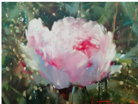
Рис. 6. Пион

знаю направление, по которому я хочу двигаться. В моей жизни появилось солнце, которое стало для меня ориентиром и маячком. Сейчас солнце в позиции восхода, оно будет подниматься выше, освещая направление моего развития. Когда ты понимаешь, что есть путь, темнота исчезает, и появляется перспектива. Главное — продолжать двигаться дальше в этом направлении, потому что мне комфортно и интересно... (см. рис. 7).