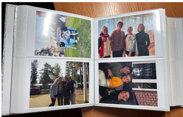
Рис. 9. Альбом жизни

Кейс № 9. 2023 год стал для меня годом личного развития. Я выросла как личность. Каждый день — это страничка моего «фотоальбома». Особо важные — те, что связаны с проектом. Выезды в детские дома и интернаты, лагерь, фестиваль «Завалинка» — это те фотографии в альбоме, на которые я смотрю с особым трепетом. В проекте я была и буду детям не просто наставником-вожатым, но и, самое главное, — другом, которому они могут рассказать свои проблемы или радости. Я считаю, что вести свой личный фотоальбом — это хорошая традиция (см. рис. 9).