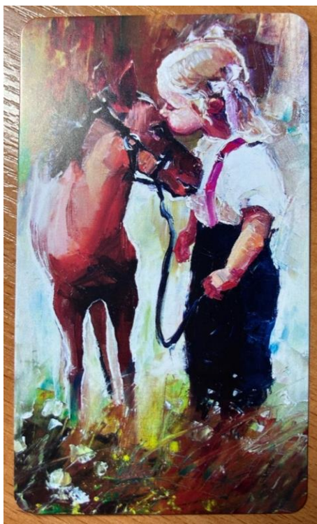
Рис. 13. Я, лошадка и ребенок