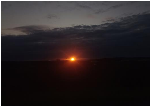
Рис. 7. Восход солнца

Кейс № 8. Это цветок. Он отражает мое ощущение от тех личностных изменений, которые происходят внутри меня благодаря проекту. Люди, которые окружают в проекте, и я сама помогаем ему расти, развиваться, находить силы, обретать уверенность. Цветок нуждается во внимании, заботе, подкормке, уходе, уходе. Требуется постоянное наблюдение и уход за ним. В проекте я научилась ухаживать и взращивать свой цветок, дарить ему поддержку и помощь. Я расту, развиваюсь, стараюсь быть полезной детям и своим друзьям-волонтерам. Я с удовольствием делюсь с окружающими своими умениями и