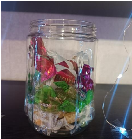
Рис. 2. Банка профессиональных навыков

Проект помогает мне открывать эту коробочку, структурировать в ней собственный багаж опыта, которым я обладаю. Теперь я знаю, что лежит в каждом уголке... (см. рис. 3).