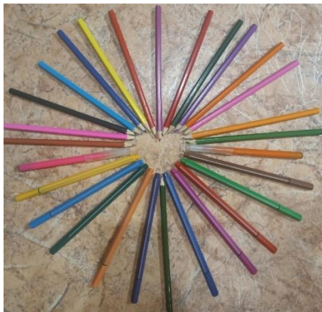
Рис. 11. Разнообразие

поведения детей. Взаимодействие с ними приносит мне положительные эмоции, заряжает на дальнейшую работу с ними. Новое отношение и чувство к детям начались с первых трех поездок в организацию. Я увидела, что наш приезд приносит детям частичку счастья. Хотя бы на небольшой промежуток времени дети отвлекаются от своих проблем, наполняются новыми знаниями, участвуют в интересных мероприятиях. Чтобы у ручек не заканчивался стержень, карандаши не ломались и фломастеры не пересыхали, периодически я ищу способы их дальнейшего совершенствования. На фото выложено сердечко из ручек, карандашей, фломастеров, это та любовь, которую я даю детям... (см. рис. 11).