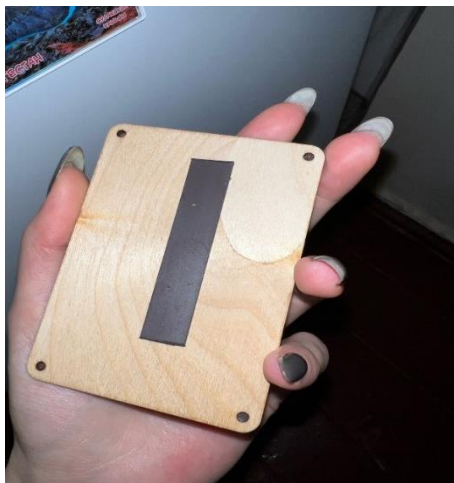
Рис. 12. Магнит любви к детям