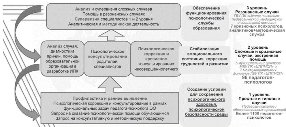
Рис. 1. Региональная модель Службы Пермского края

В Пермском крае реализуется трехуровневая модель Службы (рис. 1). На первом уровне психологическое сопровождение осуществляют педагоги-психологи образовательных организаций по типовым запросам. Задача оказания психологической помощи — создание психологически безопасной образовательной среды, профилактика и раннее выявление нарушений у обучающихся. Второй уровень — сопровождение педагогами-психологами ППМС-центров экстренных и кризисных ситуаций. На третьем уровне ГБУ ПК «Центр психолого-педагогической, медицинской и социальной помощи» сопровождаются резонансные случаи, реализуется аналитическая и методическая деятельность, проводятся супервизии для специалистов первого и второго уровня [15].