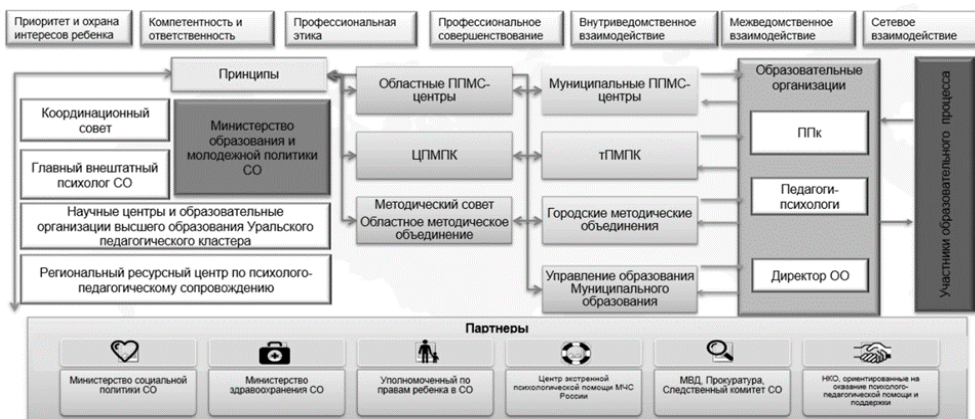
Рис. 2. Региональная модель Службы Свердловской области

через реализацию основных видов профессиональной деятельности. При возникновении проблем в обучении, воспитании и развитии у обучающихся в образовательной организации проводится психолого-педагогический консилиум (далее — ППК). На третьей ступени ППМС-центры оказывают методическую и консультативную помощь, содействуют реализации особых образовательных условий для обучающихся; оказывают экстренную психологическую помощь; проводят мероприятия, содействующие эффективной реализации профессиональной деятельности педагогов-психологов [2]. Обращение в данные организации может происходить по направлению ППК, педагога-психолога образовательной организации или по индивидуальному запросу родителей (законных представителей) [14].