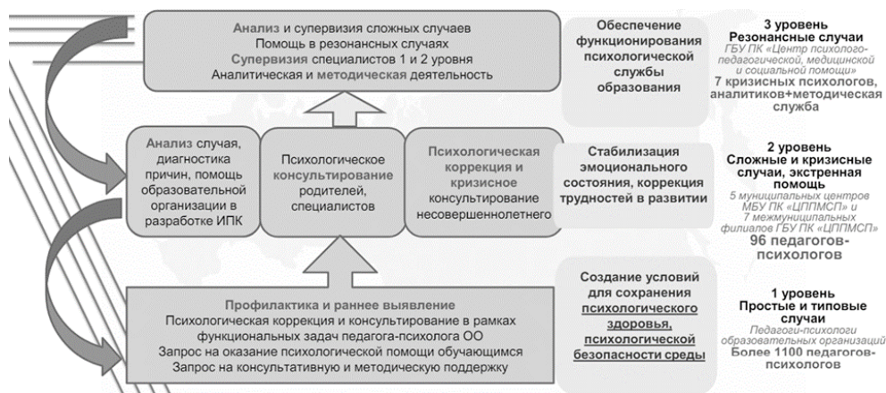
Рис. 1. Региональная модель Службы Пермского края

В Пермском крае реализуется трехуровневая модель Службы (рис. 1). На первом уровне психологическое сопровождение осуществляют педагоги-психологи образовательных организаций по типовым запросам. Задача оказания психологической помощи — создание психологически безопасной образовательной среды, профилактика и раннее выявление нарушений у обучающихся. Второй уровень — сопровождение педагогами-психологами ППМС-центров экстренных и кризисных ситуаций. На третьем уровне ГБУ ПК «Центр психолого-педагогической, медицинской и социальной помощи» сопровождаются резонансные случаи, реализуется аналитическая и методическая деятельность, проводятся супервизии для специалистов первого и второго уровня [15].