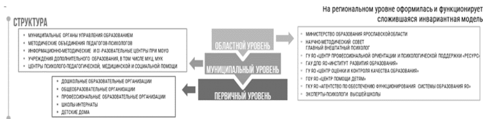
Рис. 4. Региональная модель Службы Ярославской области

Описанные выше уровни являются основными и составляют единую инвариативную модель Службы Ярославской области. При этом существует несколько вариаций организации психологического сопровождения в зависимости от потребностей участников образовательных отношений в муниципальных образованиях Ярославской области: комплексный, централизованный и сетевой варианты функционирования Службы [16].