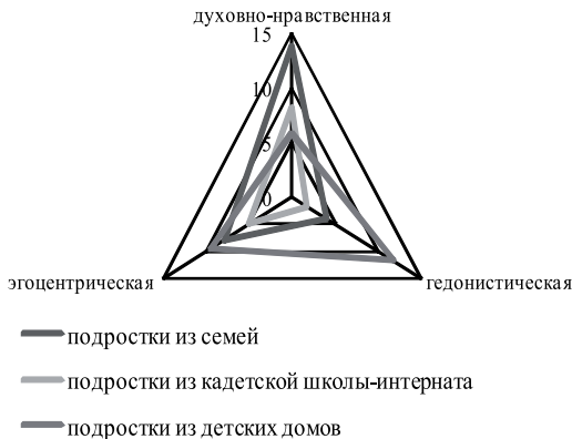
Рис. 1. Мотивация подростков, воспитывающихся в разных условиях

Духовно-нравственная мотивация у подростков-социальных сирот развита слабо. Развитие примитивных потребностей и мотивов, подчиненных принципу удовольствия, происходит в ущерб становлению интересов и привязанностей, что обуславливает дисгармоничность мотивационного профиля. Еще раз обратимся к данным Н. Н. Толстых: «В