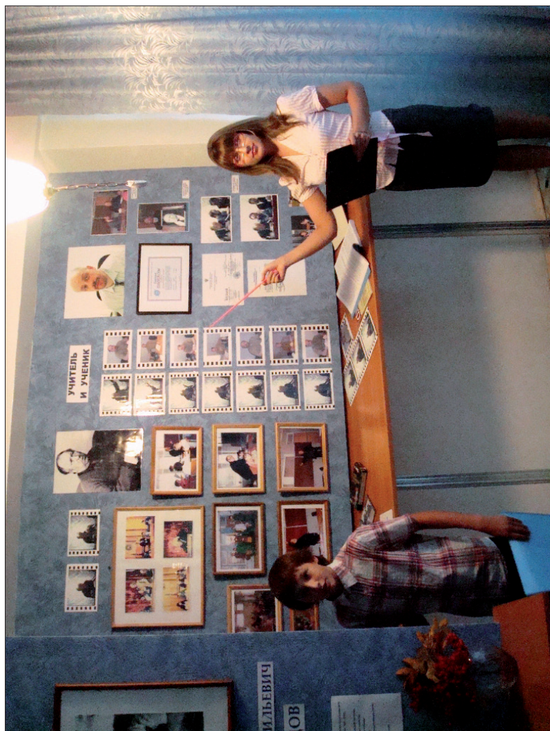
Музейная экспозиция. Экскурсию проводит старшеклассница гимназии