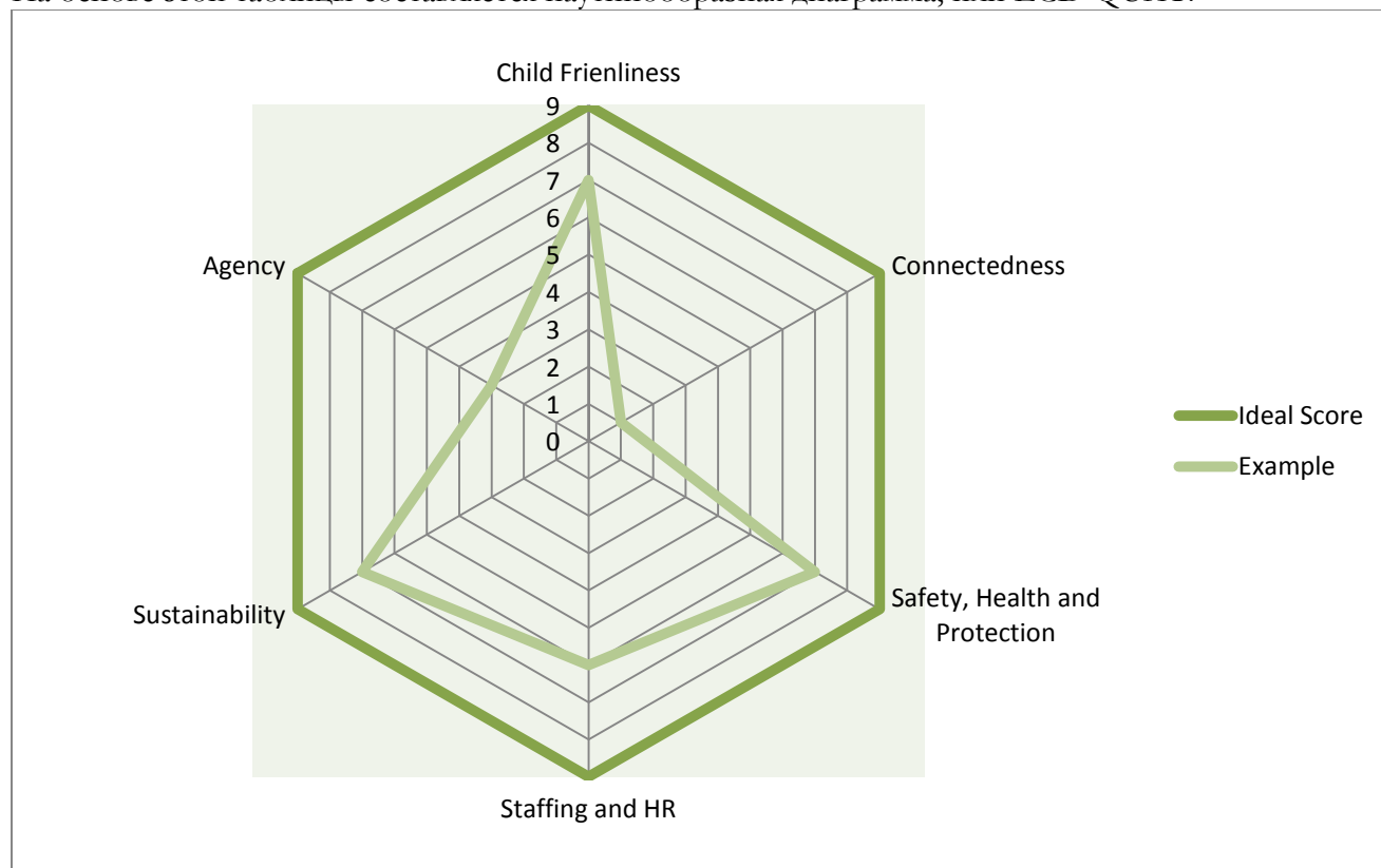
Рисунок 1: Паутинообразная диаграмма, преобразованная в ECD-QUAT.

На основе этой таблицы составляется паутинообразная диаграмма, или ECD-QUAT: