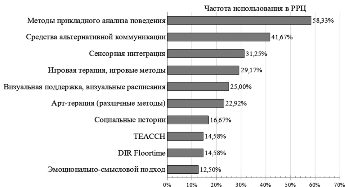
Рис. 1. Практики, наиболее часто используемые региональными ресурсными центрами