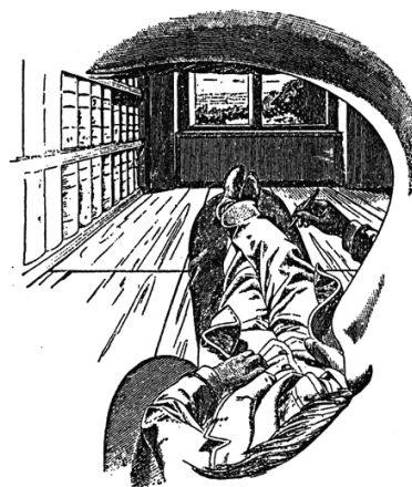
Рис. 4. Феноменальное Я (Мах [8, с. 37]) 3 . Подсказка: бровь, нос, усы

Феноменальное Я — результат уподобительной (отражательной) активности , «впитывающей» в себя социокультурные реалии жизни: поведение людей, движение вещей, акты коммуникации, знаки и обращение с ними, образ собственного подвижного физического тела индивида — всё то, что формирует «территорию Я». В контексте уподобительной активности складывается целостный «образ мира» [5], синтезирующий многообразные элементы феноме-