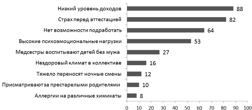
Рис. 1. Вопросы, вызывающие беспокойство медицинских сестер, %

По данным опроса, резко выделяются преобладающие основные факторы: низкий уровень доходов, страх перед аттестационными испытаниями и невозможность подработать в данном учреждении. Эти причины впоследствии могут иметь свое влияние на психоэмоциональное состояние работников.