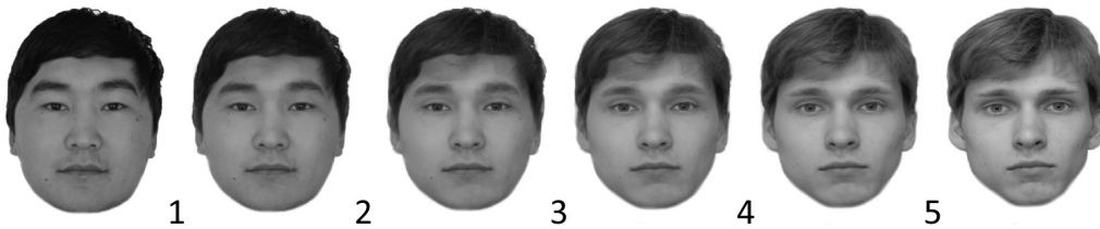
Рис. 1. Стимульный материал исследования

В исследовании использовался комплект стимульных изображений (рис. 1), включавший в себя два нативных (реальных) изображения лиц мужчин монголоидного и европеоидного типа, а также четыре изображения, полученные с использованием процедуры морфинга (шаг морфирования 20%).