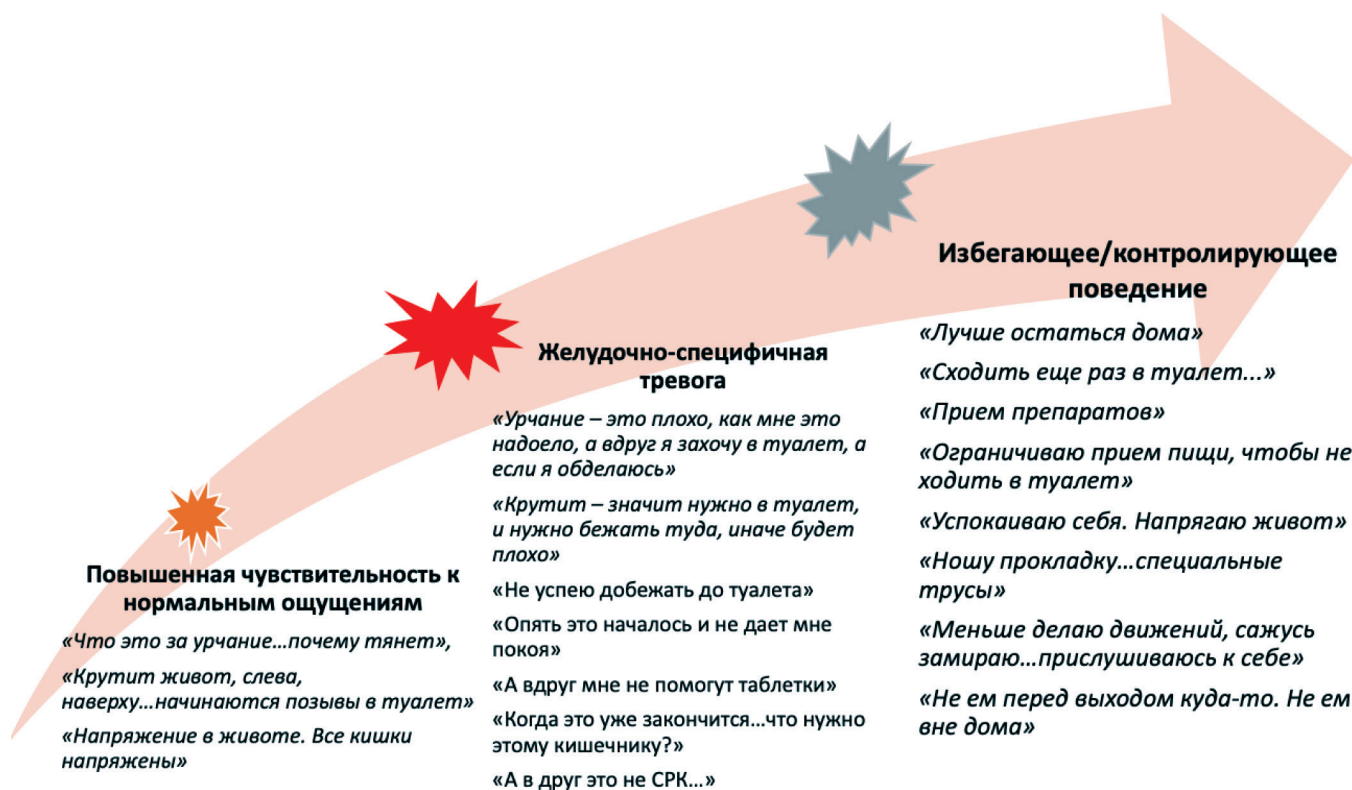
Рис. 2. Компоненты желудочно-кишечной специфической тревоги по Лукасу Ван Оуденхови [14]

Из рис. 3. видно, что выраженность и длительность симптомов СРК способствует развитию у пациента