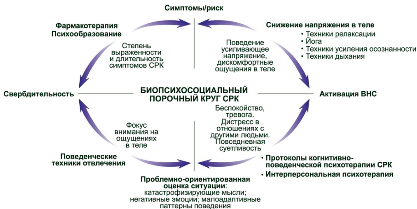
Рис. 3. Биопсихосоциальный порочный круг СРК Р.С. Вейнланда и Д.А. Дроссмана [24]. ВНС — вегетативная нервная система