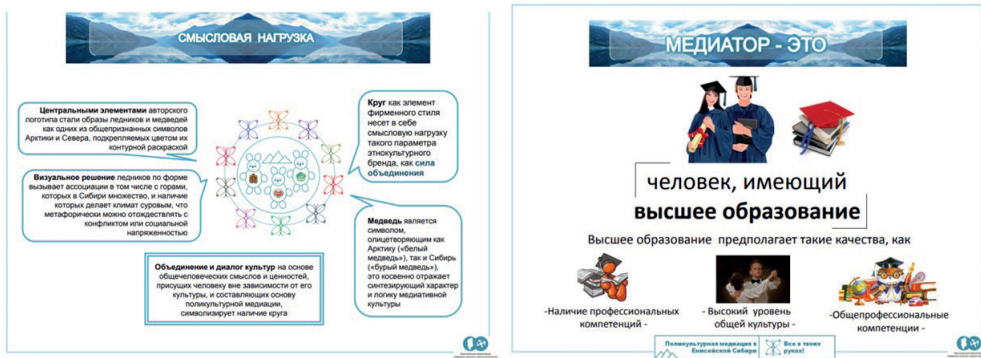
Рис. 2. Фрагменты групповых проектов по разработке фирменного стиля поликультурной медиации в Енисейской Сибири и атласа профессии медиатора социальных конфликтов, отражающих ценностно-смысловые параметры медиации как объекта брендинга

Помимо описанных выше примеров, которые с точки зрения системной логики цифровой трансформации отражают скорее опосредованный характер ее реализации к подготовке в медиации и связаны с освоением и осмыслением психолого-педагогических аспектов деятельности медиатора как методиста, в рамках обучения магистранты также целенаправленно разрабатывали практико-ориентированные методические ресурсы, направленные на решение профессионально-методических задач с учетом междисциплинарных аспектов медиации. Поскольку один из компонентов методической готовности (в частности, теоретико-методологический) напрямую связан с задачами и миссией магистерской подготовки в части решения прикладных задач в профессиональной деятельности средствами научной методологии, то, например, в первом семестре в рамках научно-исследовательской практики магистрантам требовалось разработать и апробировать диагностический инструментарий, ориентированный на решение одной или