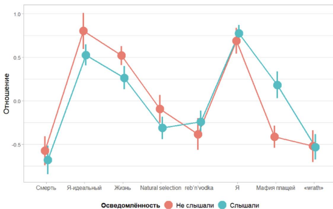
Рис. 1. Фактор «Отношение» и набор специфической терминологии

Дисперсионный анализ полученных независимых переменных показал отсутствие значимого эффекта осведомленности испытуемых о скулшутинге на фактор «Отношение к объектам», т. е. отношение к большинству оцениваемых категорий у осведомленной и не осведомленной группы не отличается, за исключением категории «Мафия плащей» (рис. 1).