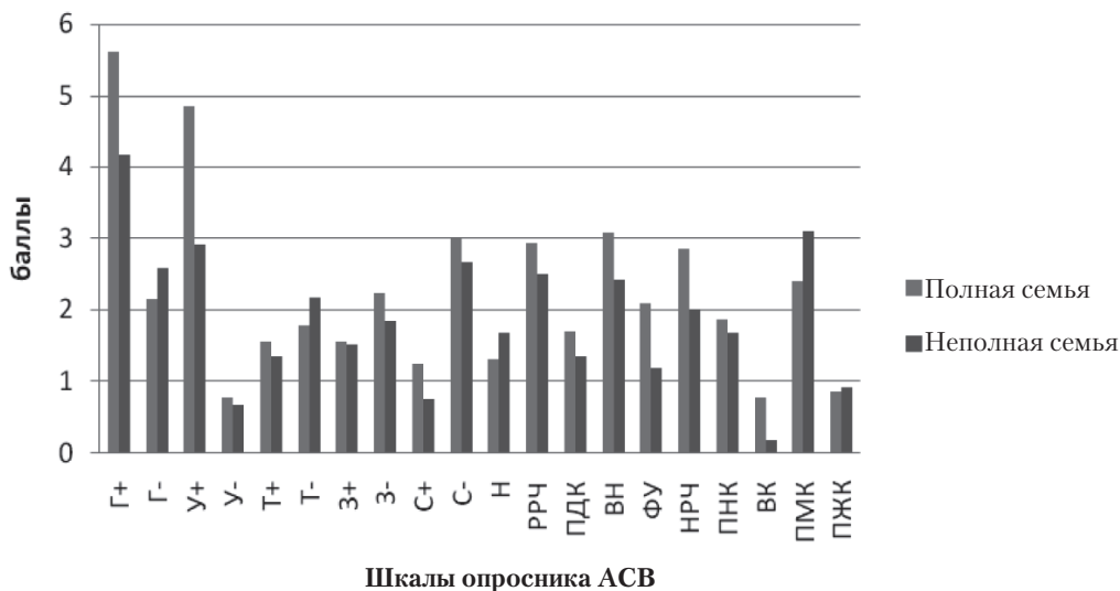
Рис. 1. Средние значения по шкалам опросника стиля семейных взаимоотношений в группах сравнения

Также для обеих групп сравнения отмечается в целом сходная картина предпочитаемых копинг-стратегий: наиболее часто встречаются такие стратегии совладания с трудностями, как планирование, позитивное переформулирование и активное совладание, а реже всего предпочитается использование успокоитель-