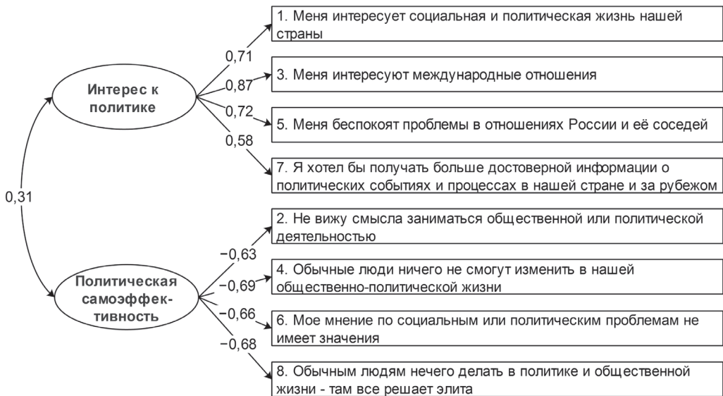
Рис. 1. Факторная модель опросника вовлеченности в политику: все приведенные путевые коэффициенты значимы при p < 0,01

получены статистически значимые прямые корреляции между интересом к политике и сплывающими моральными основаниями («лояльность», «уважение», «чистота»), а также моральным основанием «справедливость». Корреляция пола с политической самооэффективностью показала, что мужчины считают себя более способными повлиять на политические события. Кроме того, корреляции с моральными основаниями говорят о том, что для мужчин менее важны справедливость и чистота. Возраст слабо, но статистически значимо связан с намерением голосовать, интересом к политике и сплывающими моральными основаниями («лояльность», «уважение», «чистота»).