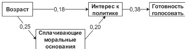
Рис. 3. Путевая модель связей возраста, сплывающих моральных оснований, интереса к политике и намерения голосовать: все приведенные путевые коэффициенты значимы при p < 0,05